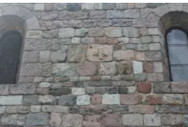
Wycieczka z Ewą Rapicką