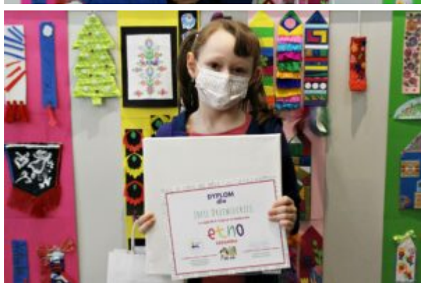
Rozstrzygnięcie konkursu "Etno-zakładka"