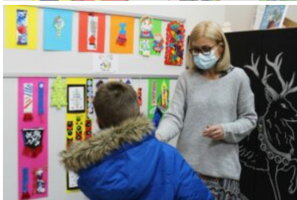
Rozstrzygnięcie konkursu "Etno-zakładka"