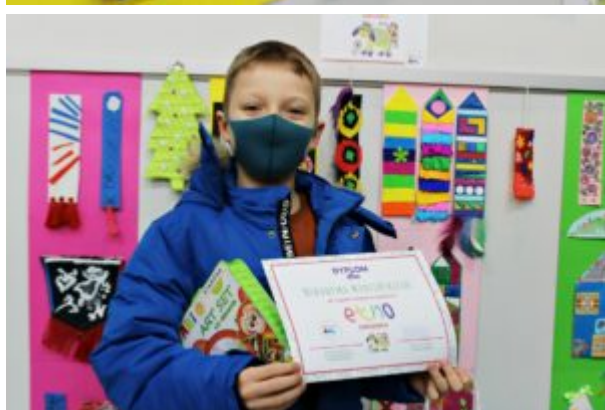
Rozstrzygnięcie konkursu "Etno-zakładka"