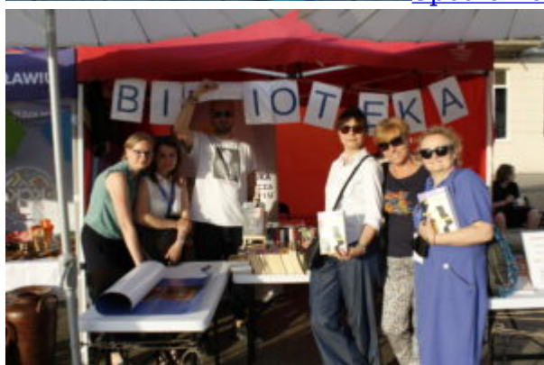
Spotkanie z Jakubem Żulczykiem