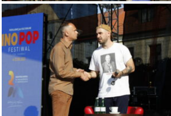
Spotkanie z Jakubem Żulczykiem