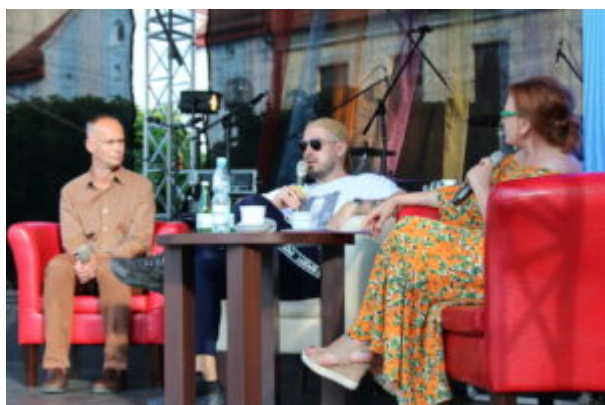
Spotkanie z Jakubem Żulczykiem