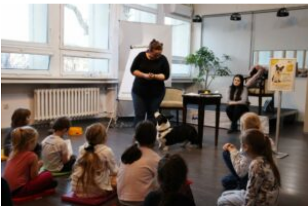
Spotkanie z T0Z