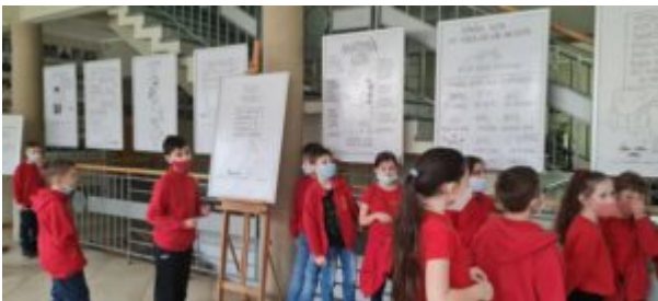
Dzień Języka Ojczystego