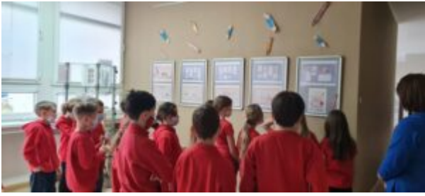
Dzień Języka Ojczystego