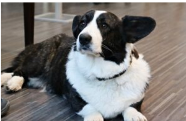
Spotkanie z T0Z