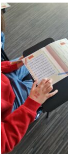
Dzień Języka Ojczystego