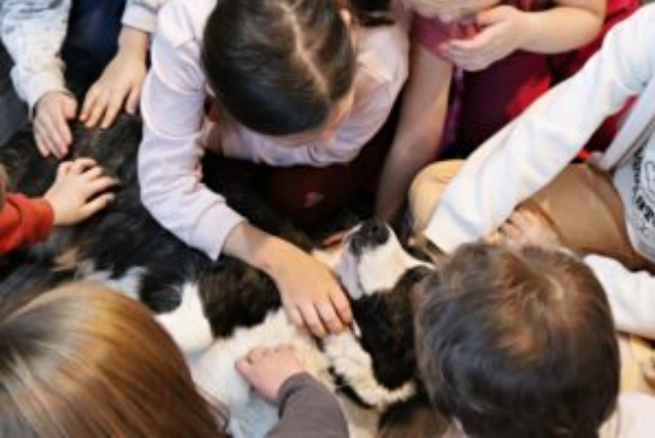
Spotkanie z T0Z