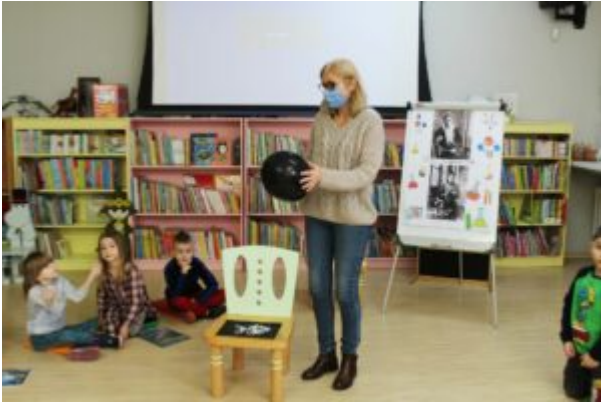
0 nauce i nie tylko