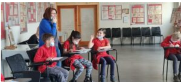
Dzień Języka Ojczystego