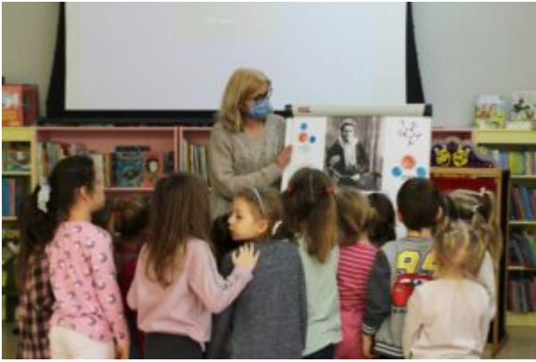
0 nauce i nie tylko