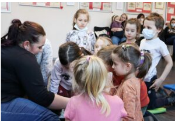
Spotkanie z T0Z