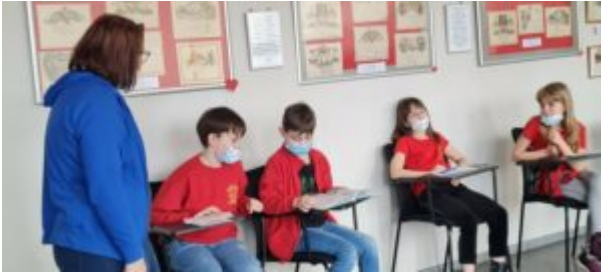
Dzień Języka Ojczystego