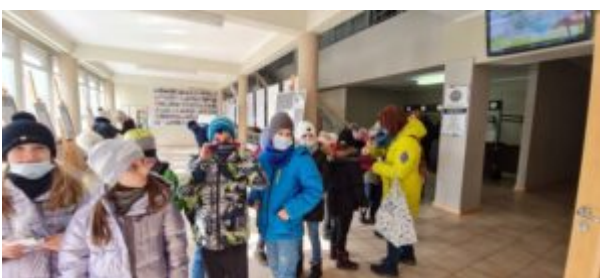
Dzień Języka Ojczystego

Dziś z okazji Dnia Języka Ojczystego księżnicę odwiedzieli uczniowie III klasy Niepublicznej Szkoły Podstawowej „Jagiellonka”. Dzieciaki zwiedziły wystawę dotyczącą zapożyczeń językowych a także ekspozycję poświęconą kotom. Po tym przyszedł czas na zmagania z językiem polskim, w ramach przygotowanych przez Czytelnię Potyczek językowych . Podczas zajęć uczniowie poznawali znaczenie zapożyczonych słów i ćwiczyli łamańce językowe. Na zakończenie każdy otrzymał dyplom i biblioteczne gadżety.