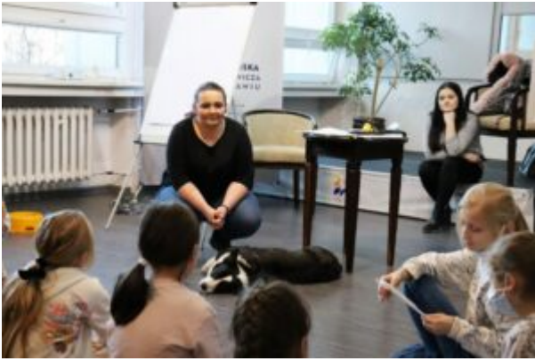
Spotkanie z T0Z