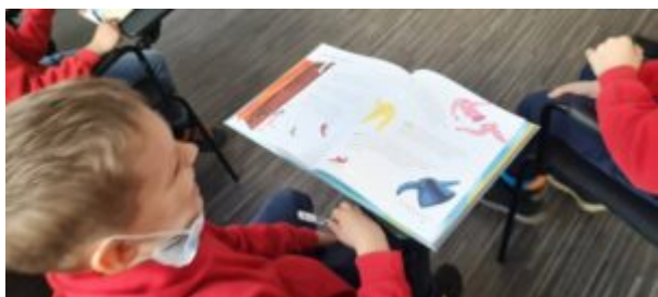
Dzień Języka Ojczystego