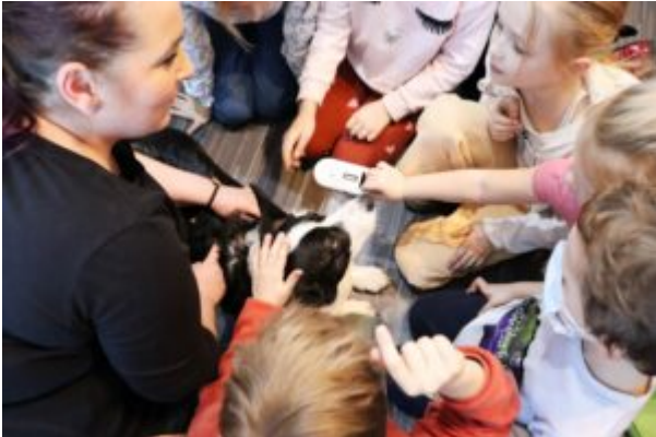
Spotkanie z T0Z