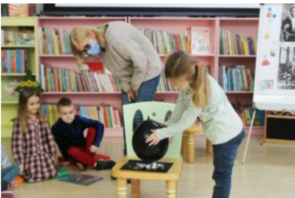
0 nauce i nie tylko