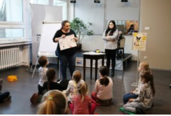
Spotkanie z T0Z