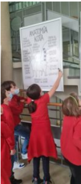
Dzień Języka Ojczystego