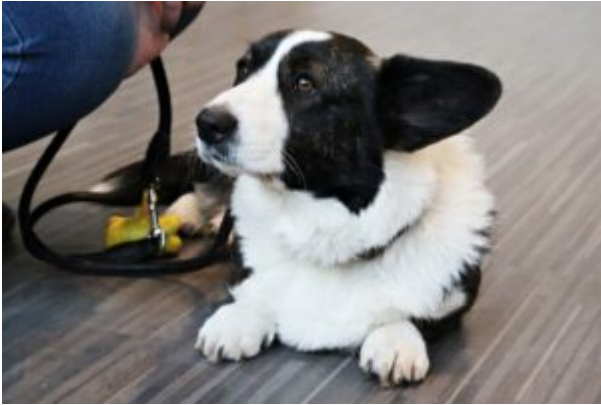
Spotkanie z T0Z