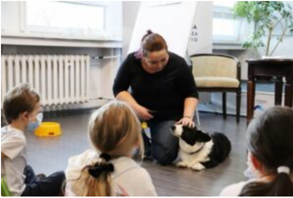
Spotkanie z T0Z