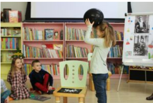
0 nauce i nie tylko