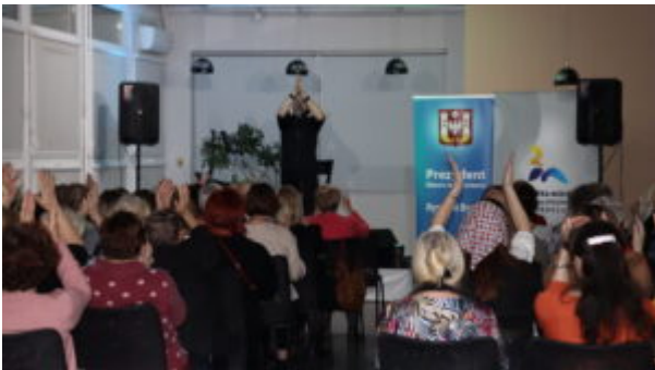
Orkiestrowe granie w bibliotece