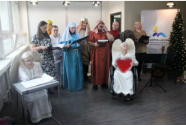
W Bibliotece kolędownali