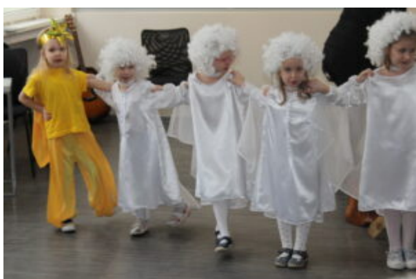
W Bibliotece kolędowali

Tradycją stały się noworoczne spotkania przy choince. W tym roku, także w Saloniku Literacko-Artystycznym zagościły grupy kolędnicze. Dzieci z Przedszkola Nr 14 „Muzyczna kraina” wystąpiły z jasełkami „Ach, co za noc”. Uczestnicy Środowiskowego Domu Samopomocy przybyliżyli zwyczajne bożonarodzeniowe z różnych regionów kraju, a mieszkańcy Domu Pomocy Społecznej z Parchania przedstawili jasełka pt. „Cicha Noc, Święta Noc”. Natomiast licznie zebrana publiczność, aktywnie włączyła się do śpiewania kolęd i pastorałek wspólnie z uczestnikami Integracyjnego Centrum Aktywności „Nadzieja Życia”, Domu Dziennego „Senior+” z Żalinowa oraz Domu Dziennego Pobytu „Bursztynowy senior”. Wiele radości i optymizmu wniosło to pierwsze, wspólne wielopokoleniowe spotkanie.