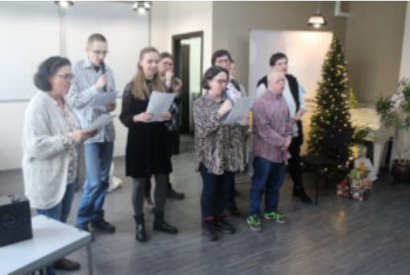
W Bibliotece kolędownali