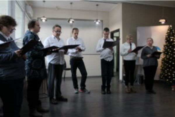
W Bibliotece kolędowali