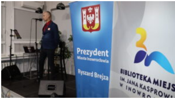
Orkiestrowe granie w bibliotece