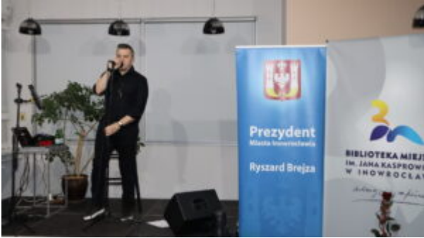
Orkiestrowe granie w bibliotece