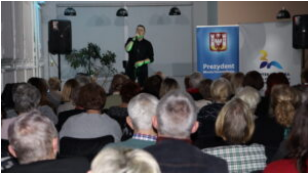
Orkiestrowe granie w bibliotece