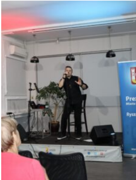
Orkiestrowe granie w bibliotece