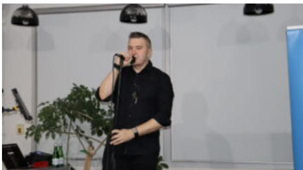
Orkiestrowe granie w bibliotece