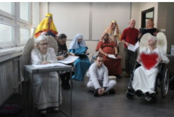
W Bibliotece kolędowali