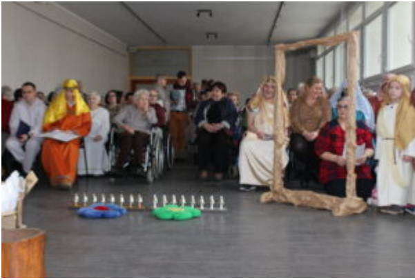
W Bibliotece kolędowali