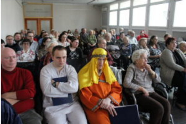
W Bibliotece kolędowali