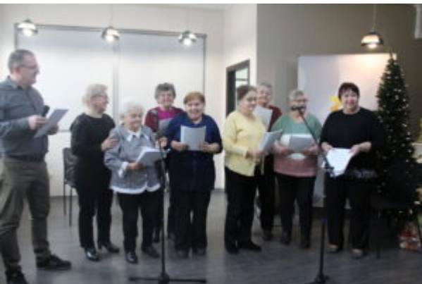
W Bibliotece kolędownali