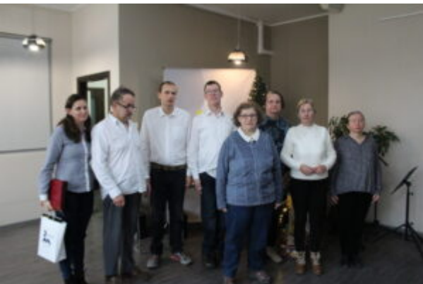
W Bibliotece kolędowali