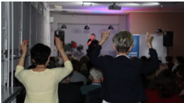
Orkiestrowe granie w bibliotece