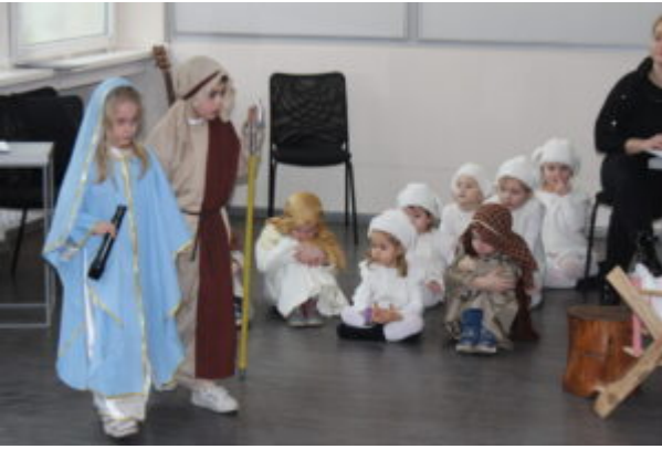
W Bibliotece kolędowali