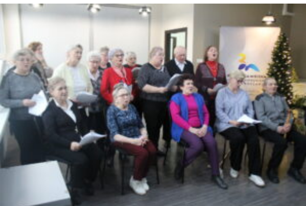
W Bibliotece kolędownali