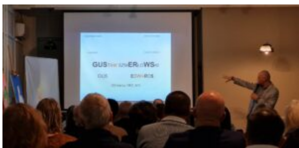
Spotkanie poświęcone Gusowi

Spotkanie odbyło się pod honorowym patronatem Prezydenta Miasta Inowrocławia.