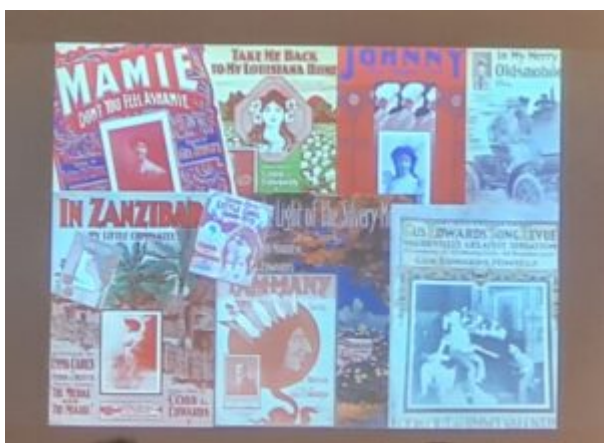
Spotkanie poświęcone Gusowi