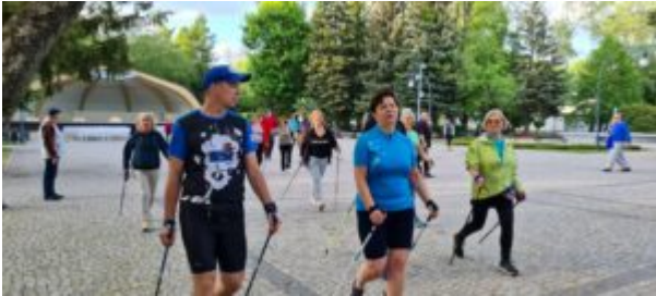
Zajęcia nordic walking