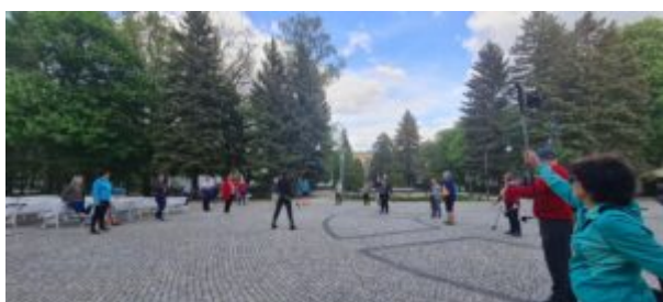
Zajęcia nordic walking