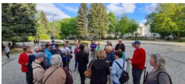
Zajęcia nordic walking