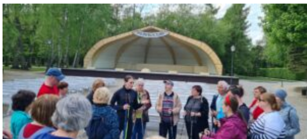
Zajęcia nordic walking

Zajęcia odbyły się w ramach projektu „Piramida aktywności”, realizowanego ze środków Fundacji ORLEN w ramach programu Moje miejsce na Ziemi.