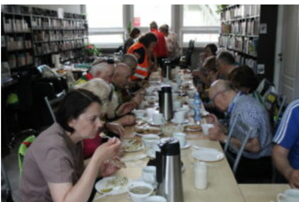
Poczęstunek w Filii nr 12