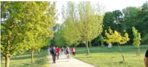
Zajęcia nordic walking