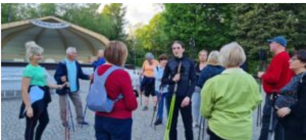
Zajęcia nordic walking