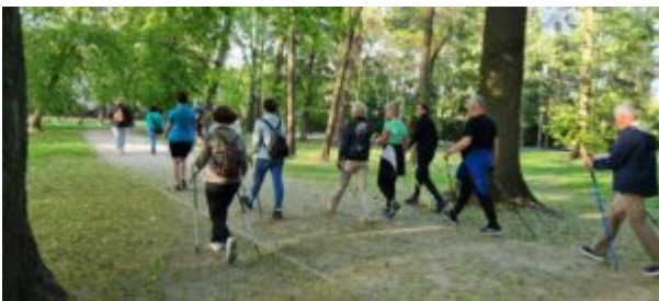
Zajęcia nordic walking