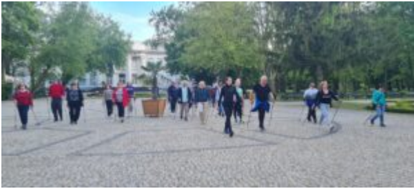
Zajęcia nordic walking