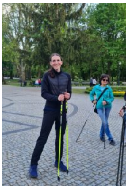
Zajęcia nordic walking