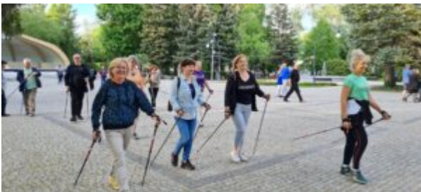
Zajęcia nordic walking