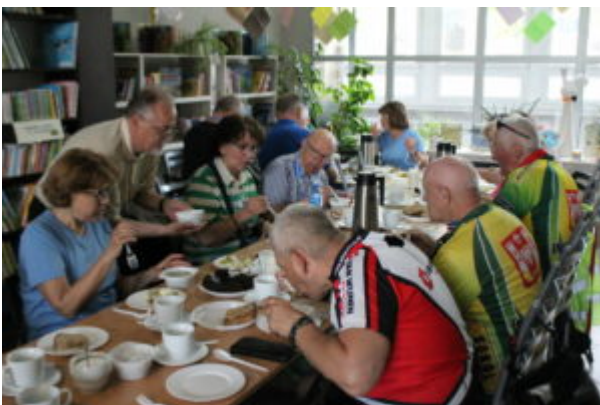
Poczęstunek w Filii nr 12