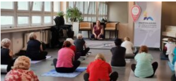
Joga dla seniora