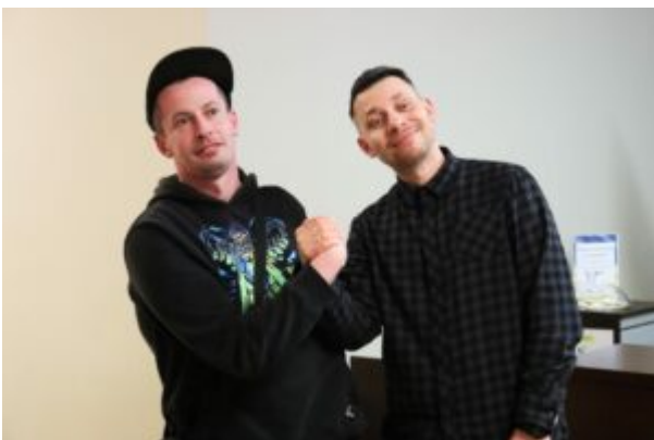
Spotkanie z Biszem