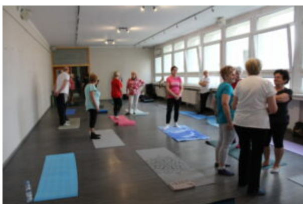
Joga dla seniora

Projekt jest realizowany ze środków Fundacji ORLEN w ramach Programu Moje miejsce na Ziemi .