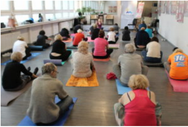
Joga dla seniora