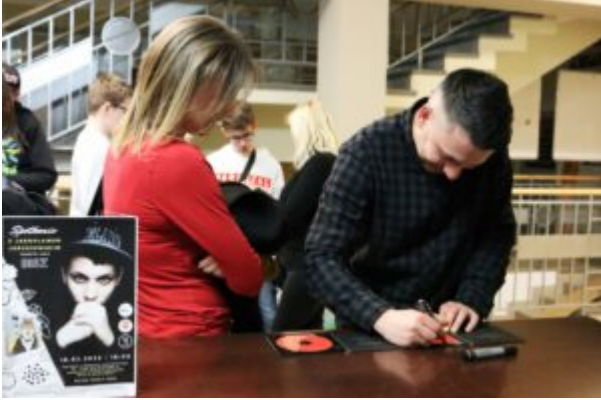
Spotkanie z Biszem