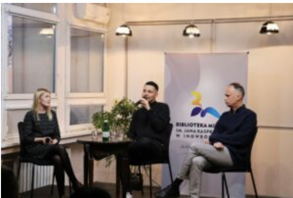
Spotkanie z Biszem