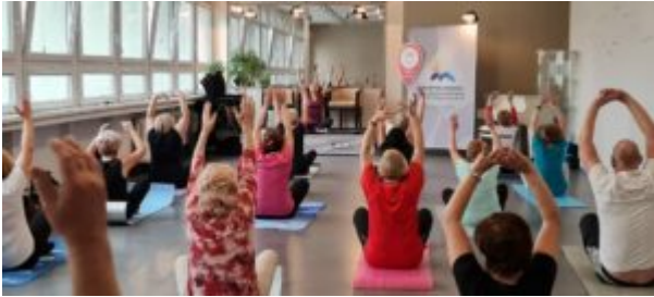
Joga dla seniora