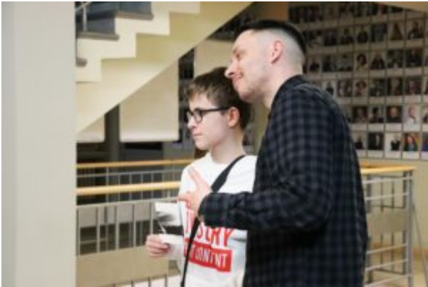
Spotkanie z Biszem