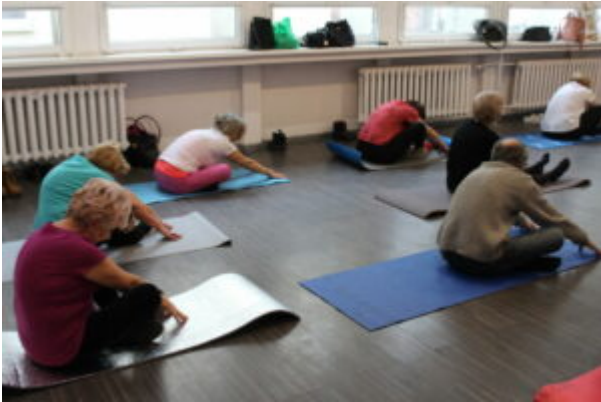
Joga dla seniora