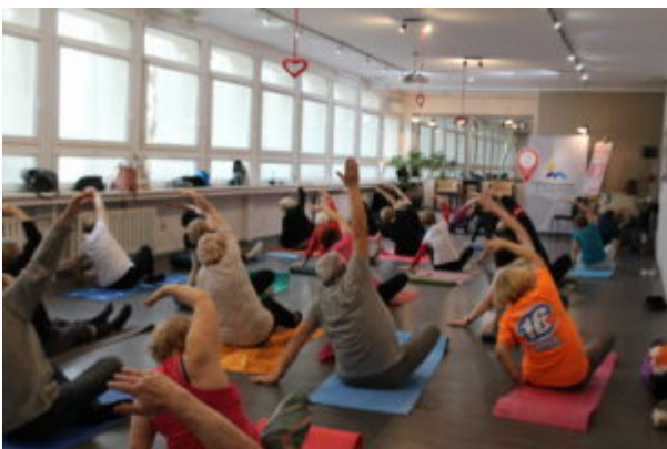
Joga dla seniora