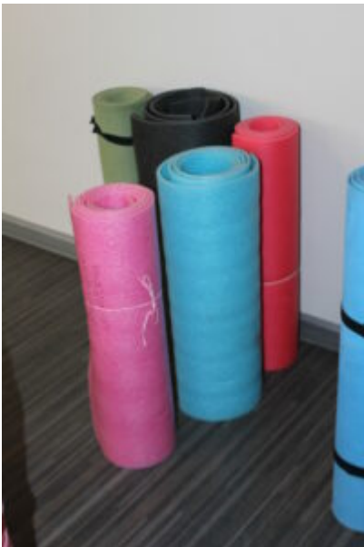
Joga dla seniora