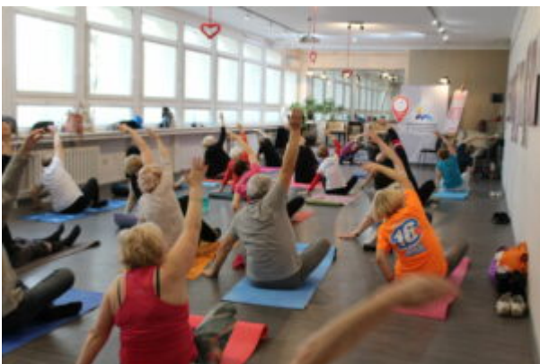
Joga dla seniora