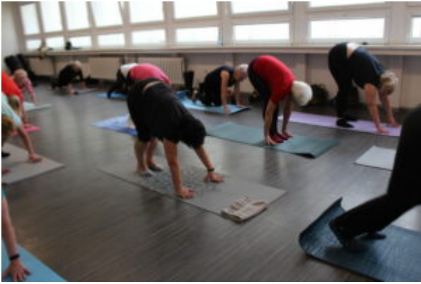
Joga dla seniora