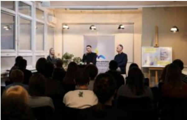
Spotkanie z Biszem