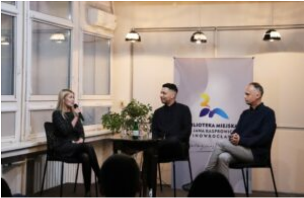
Spotkanie z Biszem