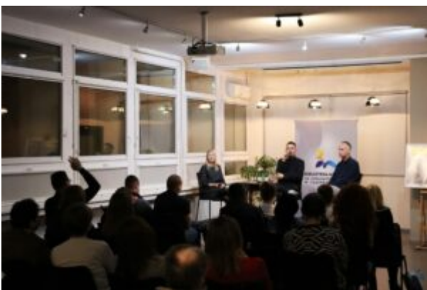
Spotkanie z Biszem