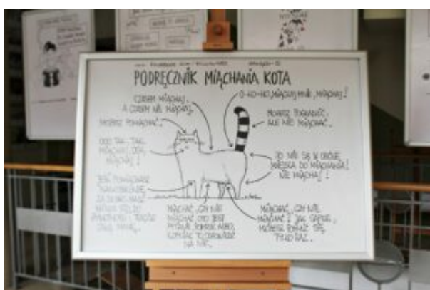
Wystawa z Kotem Jaśniepanem