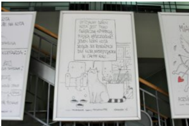
Wystawa z Kotem Jaśniepanem