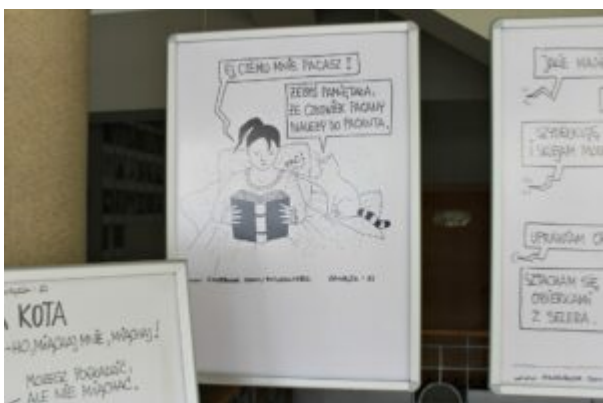
Wystawa z Kotem Jaśniepanem