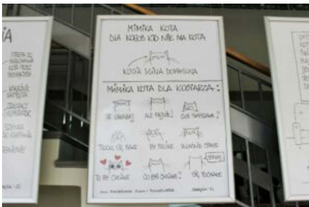
Wystawa z Kotem Jaśniepanem