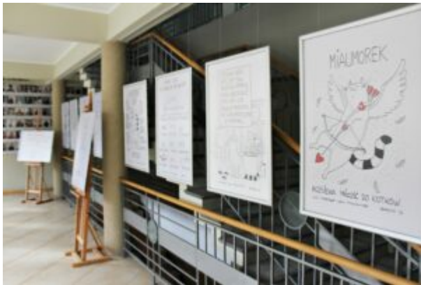
Wystawa z Kotem Jaśniepanem