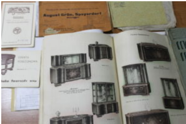
Publikacje poświęcone meblom