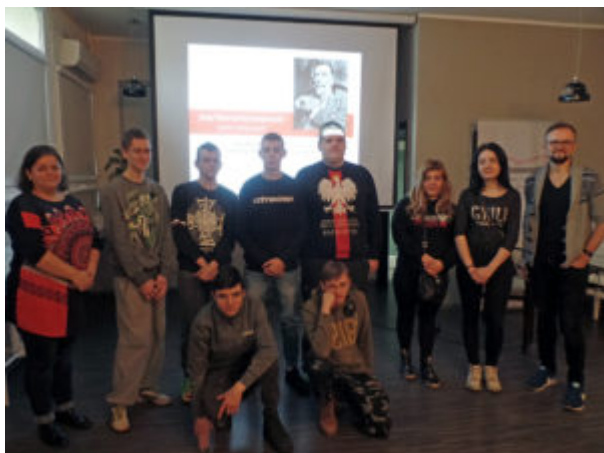
SAMSUNG CAMERA PICTURES

charakterystycznych jego twórczości oraz współczesnych kontynuatorach jego spuścizny.