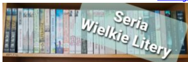
Dotacja dla biblioteki