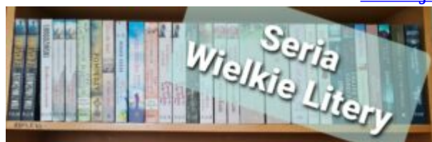
Dotacja dla biblioteki