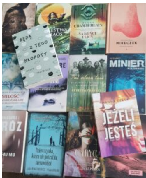
Dotacja dla biblioteki