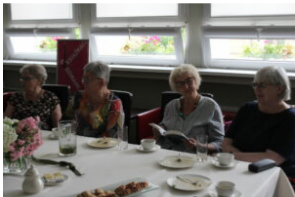
Wypożyczalnia dla Dorosłych

rozmawiać o książce Ann Patchett „Dom Holendrów”.