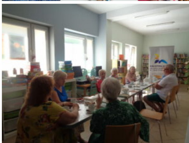
Filia nr 1