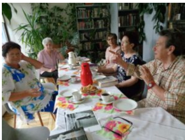
Filia nr 7