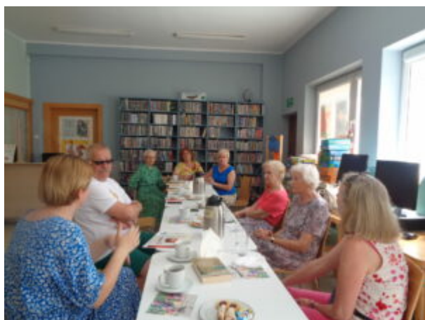
Filia nr 1