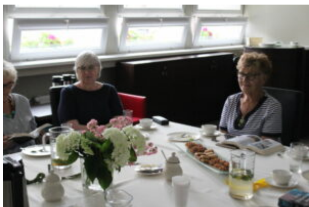
Wypożyczalnia dla Dorosłych