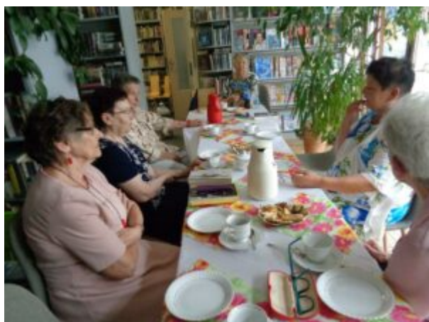
Filia nr 7