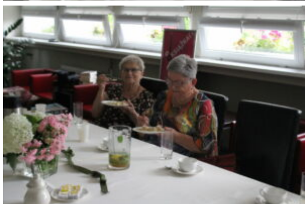
Wypożyczalnia dla Dorosłych