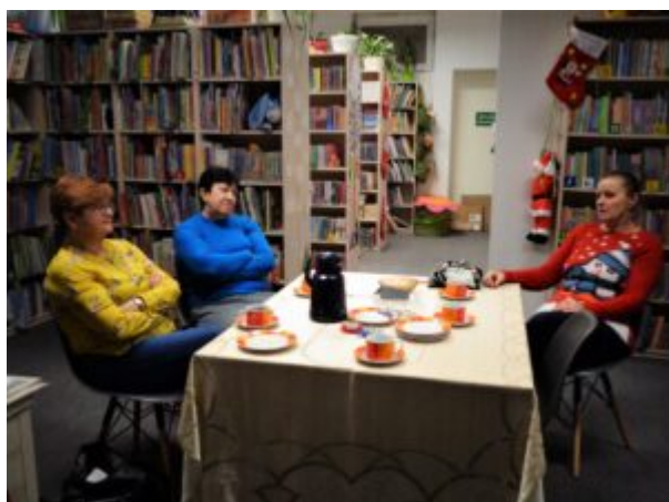
DKK F 3