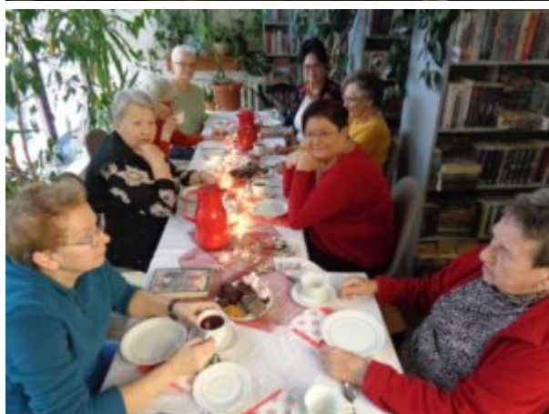
DKK F1 7