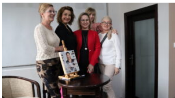
Spotkanie z Joanną Brodzik