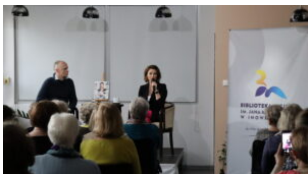
Spotkanie z Joanną Brodzik