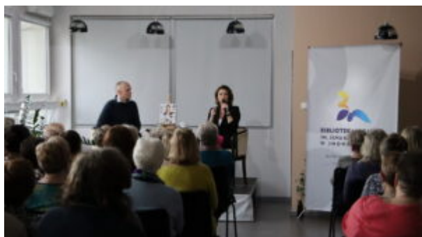
Spotkanie z Joanną Brodzik