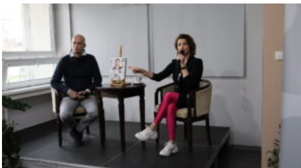
Spotkanie z Joanną Brodzik