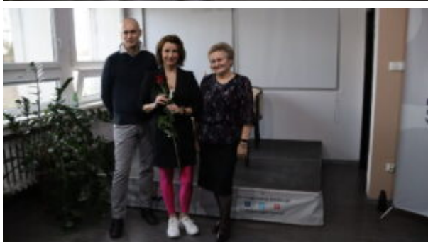
Spotkanie z Joanną Brodzik