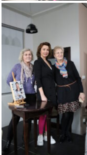
Spotkanie z Joanną Brodzik