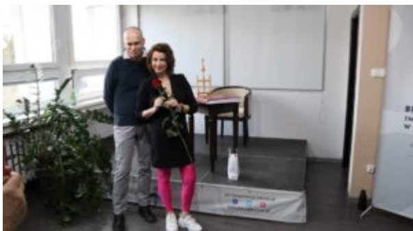
Spotkanie z Joanną Brodzik