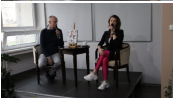
Spotkanie z Joanną Brodzik