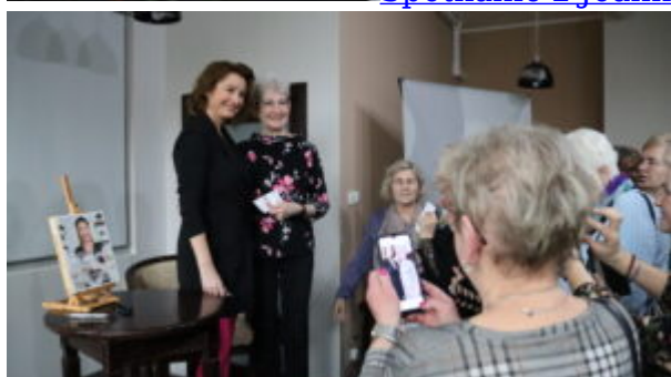
Spotkanie z Joanną Brodzik