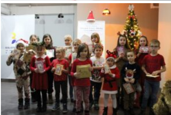
Wernisaż wystawy-Kierunek-Święty Mikołaj