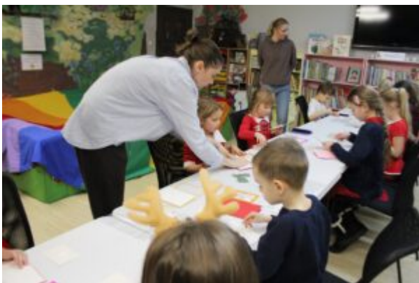
Wernisaż wystawy-Kierunek-Święty Mikołaj