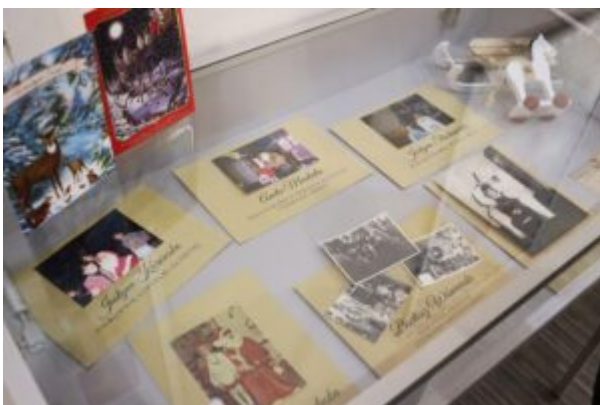
Wernisaż wystawy-Kierunek-Święty Mikołaj