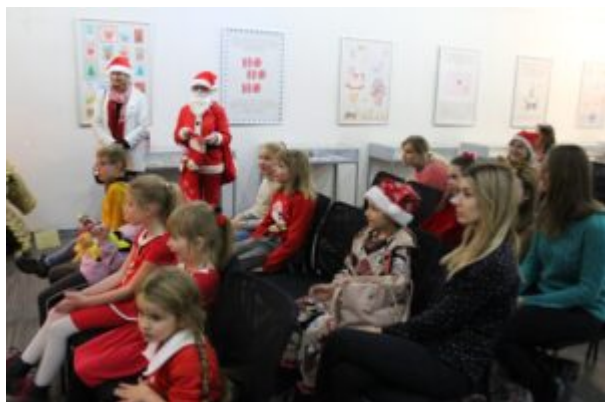
Wernisaż wystawy-Kierunek-Święty Mikołaj