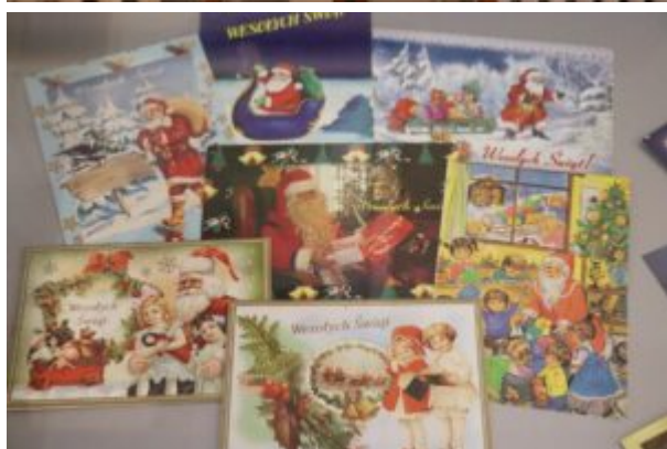
Wernisaż wystawy-Kierunek-Święty Mikołaj