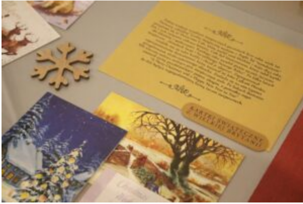
Wernisaż wystawy-Kierunek-Święty Mikołaj