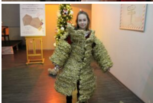
Wernisaż wystawy-Kierunek-Święty Mikołaj