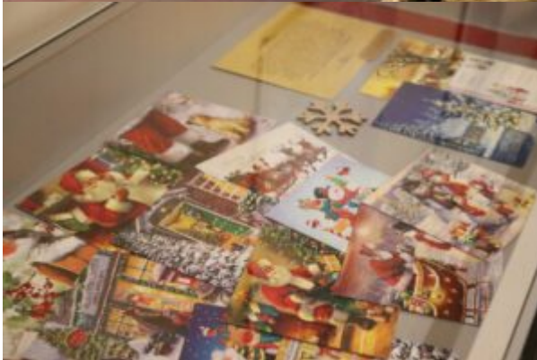
Wernisaż wystawy-Kierunek-Święty Mikołaj