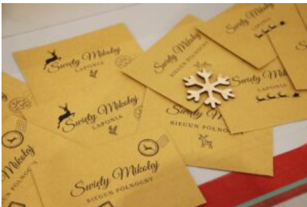
Wernisaż wystawy-Kierunek-Święty Mikołaj