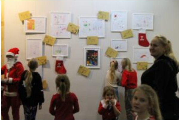
Wernisaż wystawy-Kierunek-Święty Mikołaj