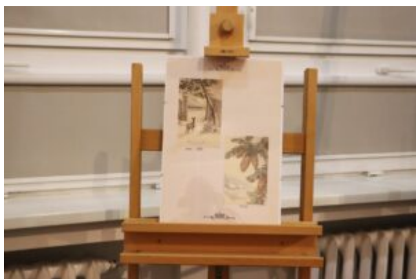
Wernisaż wystawy-Kierunek-Święty Mikołaj