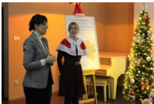
Wernisaż wystawy-Kierunek-Święty Mikołaj