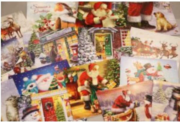
Wernisaż wystawy-Kierunek-Święty Mikołaj