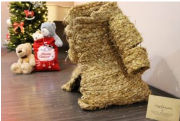
Wernisaż wystawy-Kierunek-Święty Mikołaj