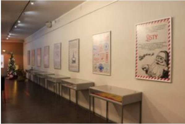
Wernisaż wystawy-Kierunek-Święty Mikołaj