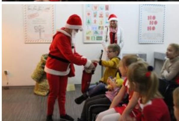
Wernisaż wystawy-Kierunek-Święty Mikołaj