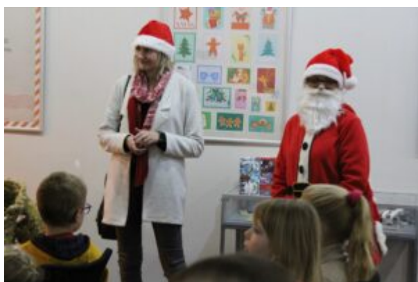
Wernisaż wystawy-Kierunek-Święty Mikołaj