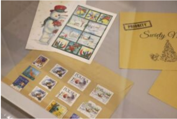
Wernisaż wystawy-Kierunek-Święty Mikołaj