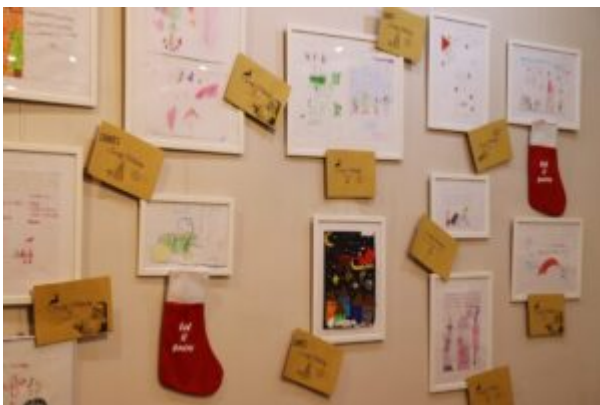
Wernisaż wystawy-Kierunek-Święty Mikołaj