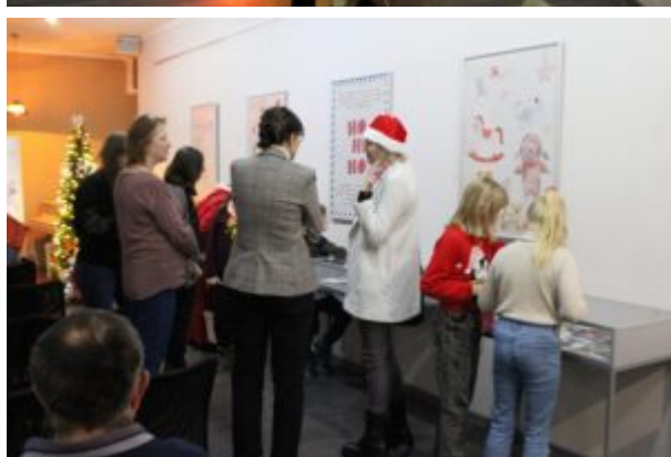
Wernisaż wystawy-Kierunek-Święty Mikołaj