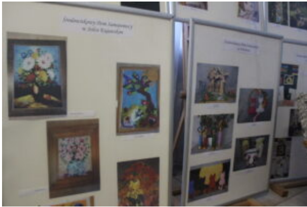
Mała galeria - wielkie serca