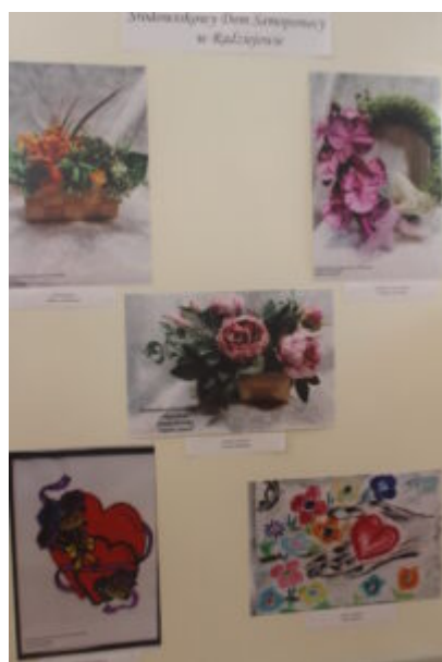
Mała galeria - wielkie serca