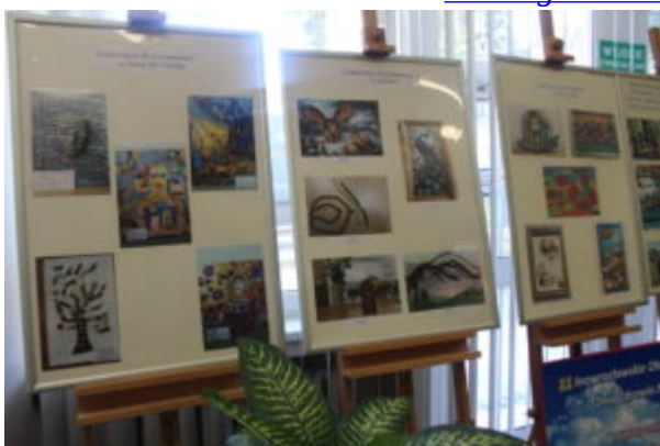
Mała galeria - wielkie serca