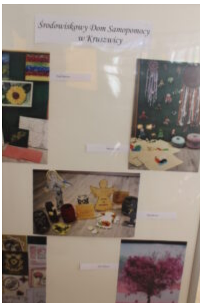
Mała galeria - wielkie serca