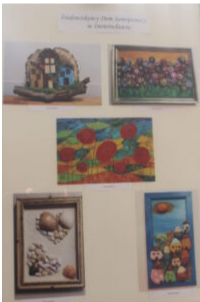
Mała galeria - wielkie serca