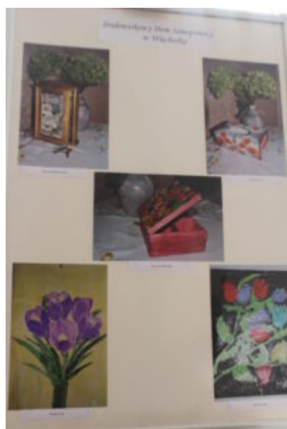
Mała galeria - wielkie serca