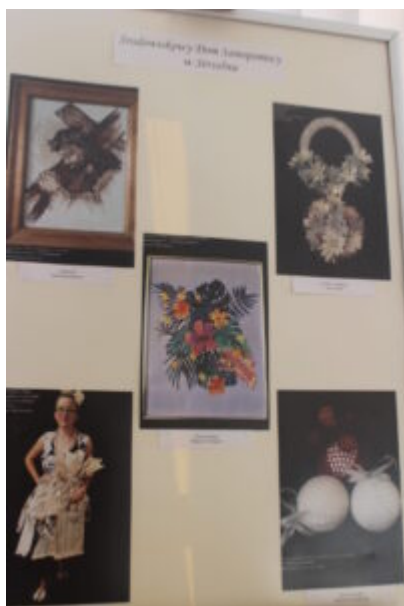
Mała galeria - wielkie serca