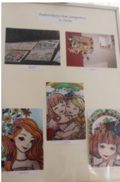
Mała galeria - wielkie serca