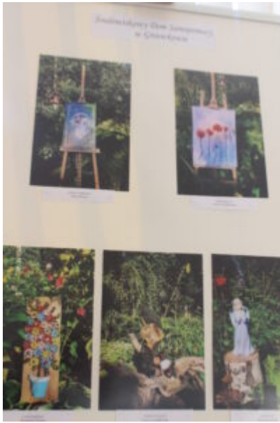
Mała galeria - wielkie serca