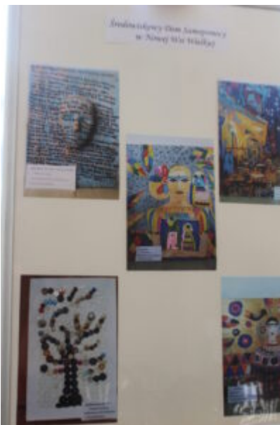
Mała galeria - wielkie serca