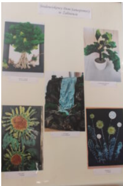
Mała galeria - wielkie serca

„Kwiaty cenimy za piękno, człowieka za dobroć” to hasło tegorocznej odsłony Światowego Dnia Zdrowia Psychicznego w Inowrocławiu. Główny organizator czyli Środowiskowy Dom Samopomocy w Inowrocławiu od wielu lat zaprasza do współpracy Środowiskowe Domy Samopomocy z Barcina, Gniewkowa, Inowrocławia, Janikowa, Kruszwicy, Nowej Wsi Wielkiej, Solca Kujawskiego, Strzelna, Więcborka, Wonorza, Żalinowa, Żnina i Radziejowa. Terapeuci utrwalają na zdjęciach całoroczną działalność swoich podopiecznych i prezentują galerię fotograficzną wybranych prac plastycznych i realizowanych warsztatów. Ekspozycję można zwiedzać w holu Biblioteki Głównej do 27 października br. Serdecznie zapraszamy !