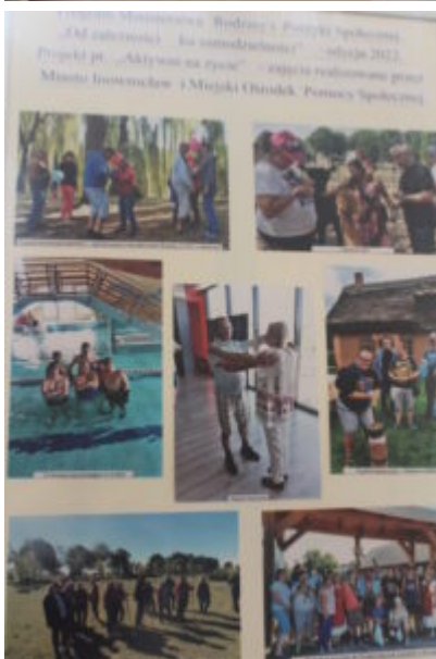
Mała galeria - wielkie serca