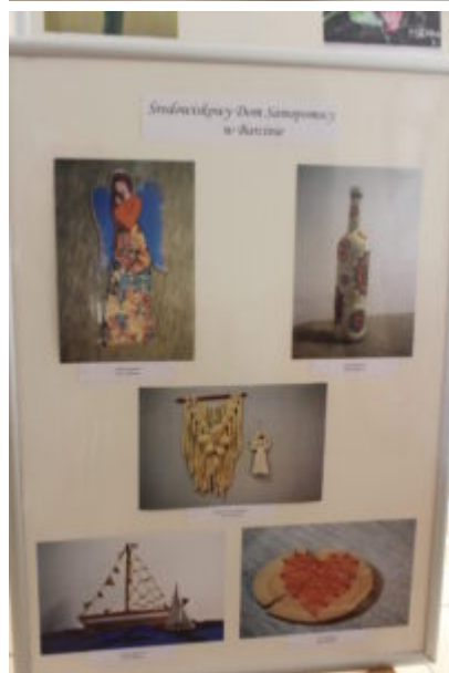
Mała galeria - wielkie serca