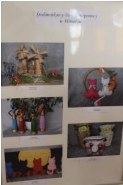
Mała galeria - wielkie serca