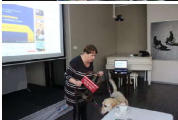
Marat, czyli pies przewodnik