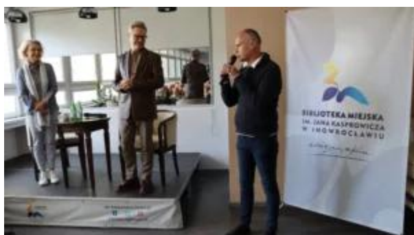
Spotkanie z Marią Pakulnis