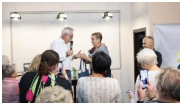
Spotkanie z Robertem Janowskim