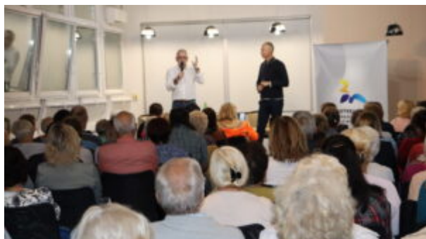
Spotkanie z Robertem Janowskim