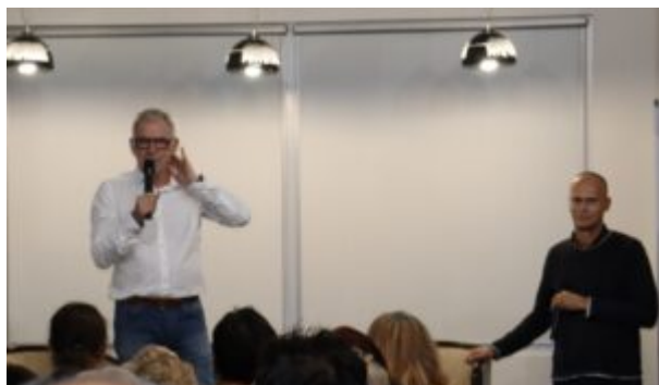
Spotkanie z Robertem Janowskim