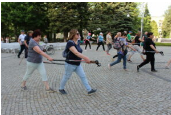
Zajęcia nordic walking