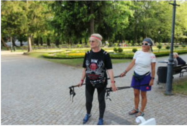
Zajęcia nordic walking