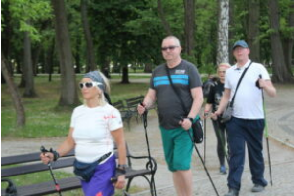
Zajęcia nordic walking