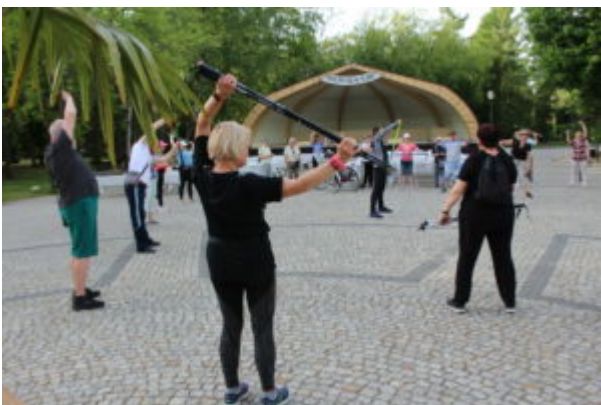
Zajęcia nordic walking