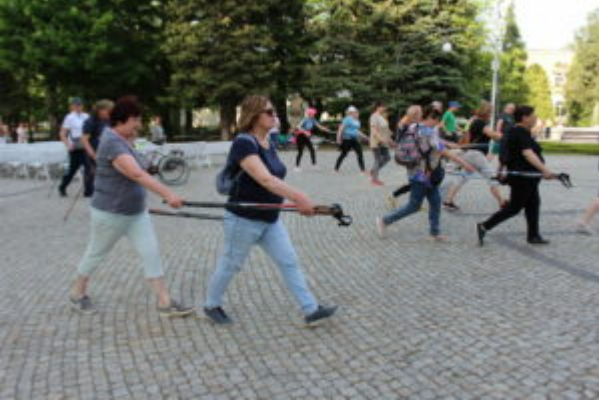
Zajęcia nordic walking