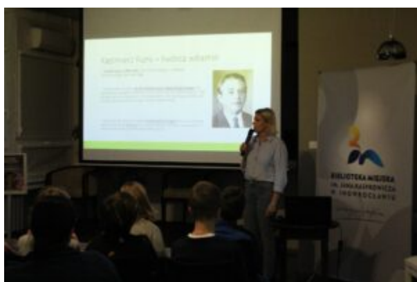
Spotkanie o Kazimierzu Funku

Wydarzenie zrealizowane w ramach projektu „Odżywić świat” dofinansowanego przez Fundację BGK w programie „Dzieci Kapitana Nemo” - Edycja III.