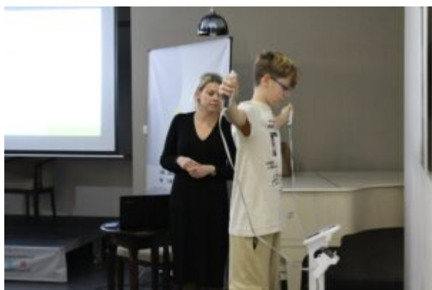
Spotkanie o Kazimierzu Funku