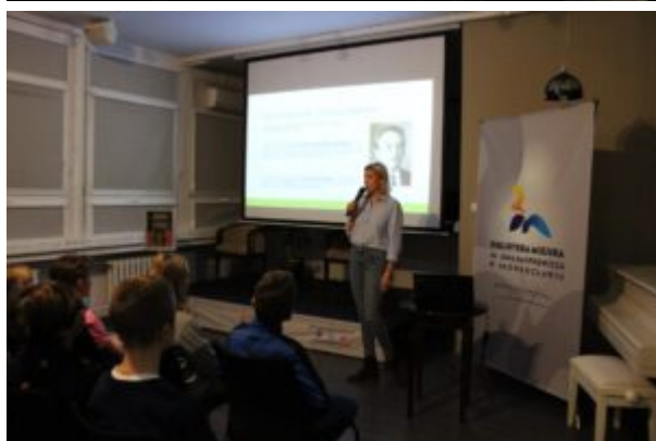
Spotkanie o Kazimierzu Funku