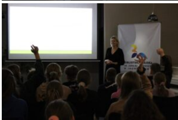
Spotkanie o Kazimierzu Funku