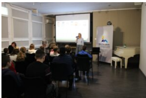
Spotkanie o Kazimierzu Funku