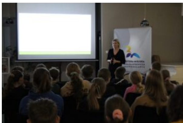
Spotkanie o Kazimierzu Funku