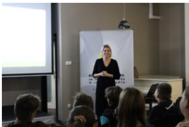
Spotkanie o Kazimierzu Funku