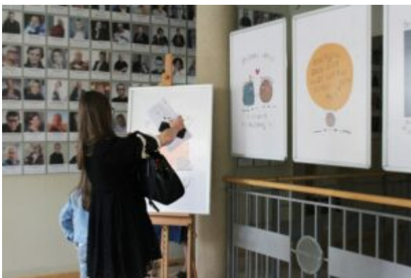
Warsztaty dla dzieci