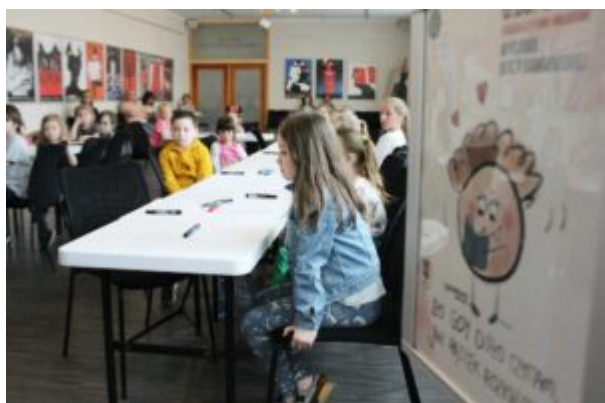
Warsztaty dla dzieci