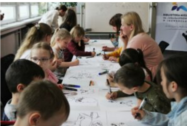
Warsztaty dla dzieci