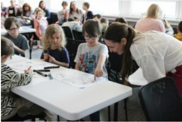
Warsztaty dla dzieci