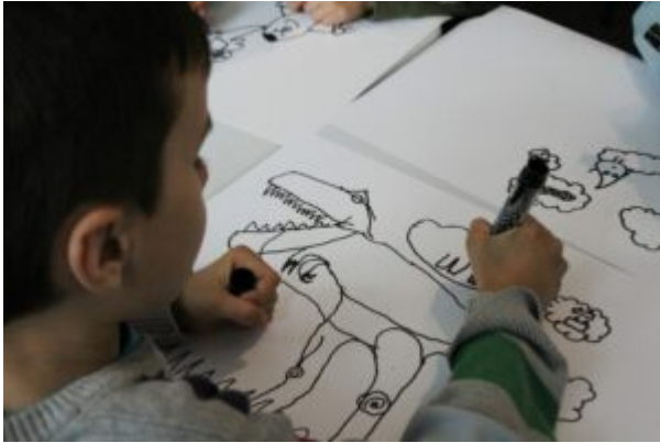
Warsztaty dla dzieci