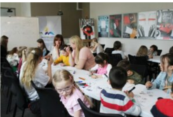
Warsztaty dla dzieci