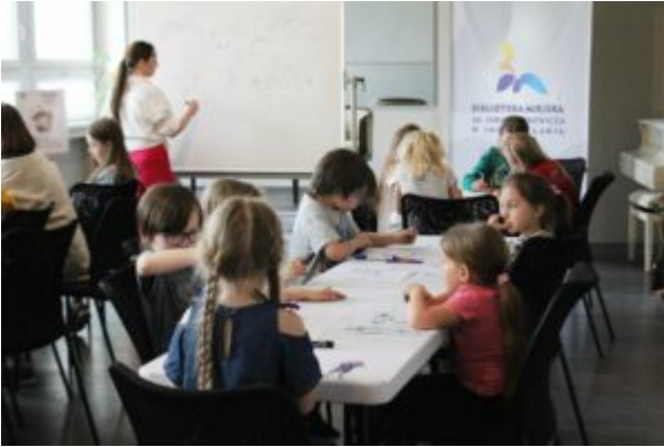
Warsztaty dla dzieci