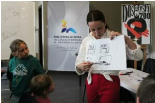
Warsztaty dla dzieci