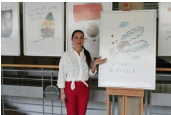
Warsztaty dla dzieci