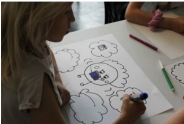
Warsztaty dla dzieci