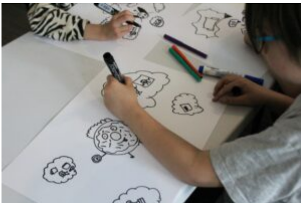
Warsztaty dla dzieci