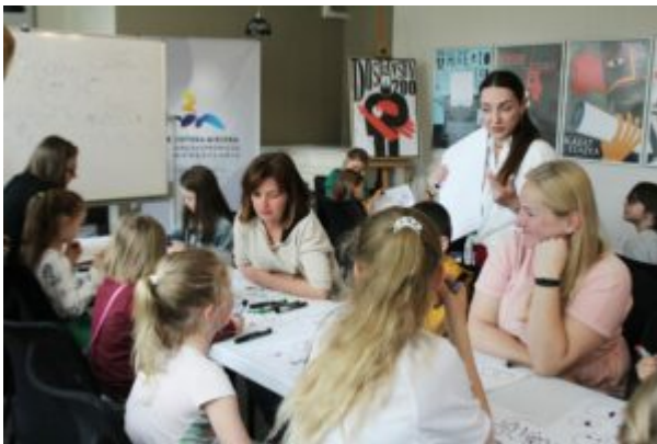
Warsztaty dla dzieci