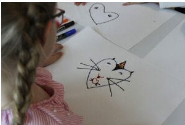
Warsztaty dla dzieci