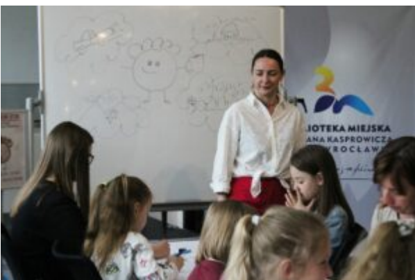
Warsztaty dla dzieci