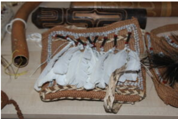
Spotkanie z podróżnikami