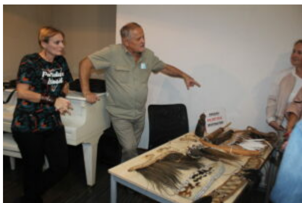
Spotkanie z podróżnikami