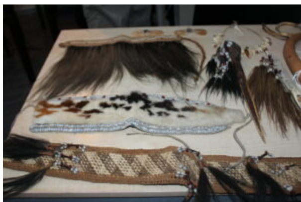
Spotkanie z podróżnikami