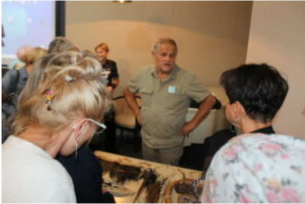
Spotkanie z podróżnikami