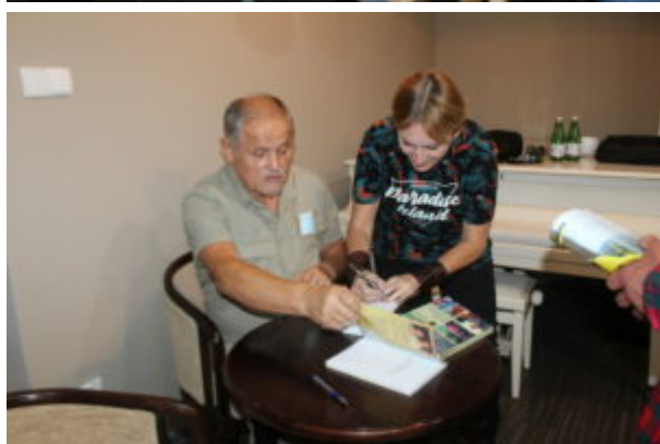
Spotkanie z podróżnikami