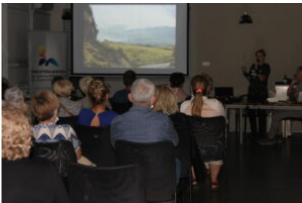
Spotkanie z podróżnikami

Spotkanie zostało zrealizowane w ramach projektu „Protokół kulturalny XV”, współfinansowanego przez Urząd Miasta Inowrocławia.