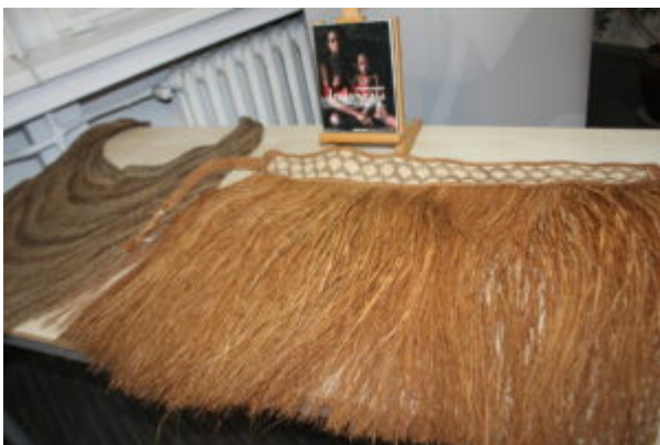
Spotkanie z podróżnikami