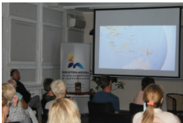
Spotkanie z podróżnikami