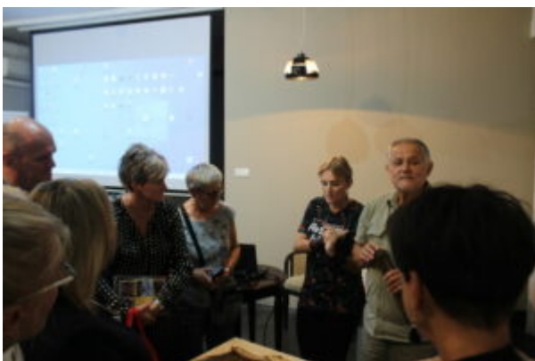
Spotkanie z podróżnikami