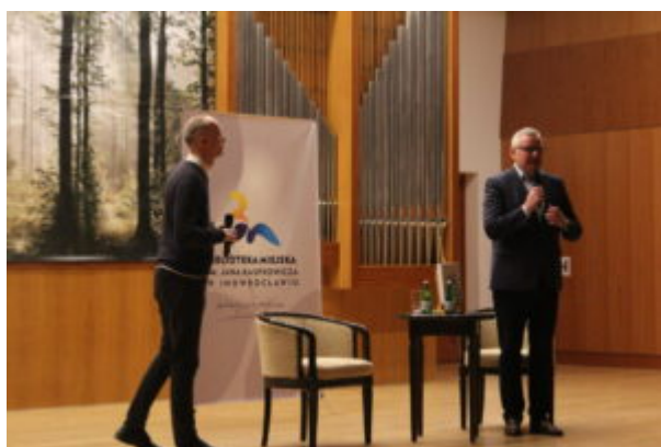
Spotkanie autorskie z Arturem Andrusiem

Nie żałował ten, kto w czwartkowe popołudnie wziął udział w spotkaniu autorskim z Arturem Andrusiem, organizowanym przez księżnicę. Duże zainteresowanie wydarzeniem spowodowało, że konieczne było znalezienie odpowiedniego miejsca, aby wszyscy chętni mogli „na żywo” spotkać tego popularnego dziennikarza, radiowca i satyryka. Dzięki uprzejmości Państwowej Szkoły Muzycznej I i II stopnia im. Juliusza Zarębskiego, skorzystano z Sali Koncertowej. Choć nie był to występ kabaretowy, gość zafundował uczestnikom mnóstwo humoru i satyry. Mogliśmy usłyszeć wspomnienia z harcerstwa, z występów w różnych zakątkach Polski, a także te dotyczące wieloletniej przyjaźni m.in.: z Marią Czubaszek, Stefanią Grodzieńską i Wojciechem Karolakiem. Uczestnicy chętnie zadawali pytania gościowi, a na zakończenie Artur Andrus chętnie pozował do zdjęć z wielbicielami, składał dedykacje w książkach i złożył pamiątkowy wpis w bibliotecznnej kronice.