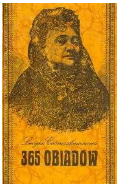
Okładka 365obiadów ze zbiorów BM INO.