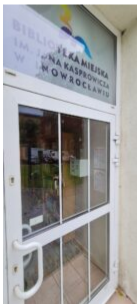
Punkt Pomocy Okresowej