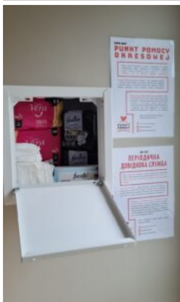
Punkt Pomocy Okresowej