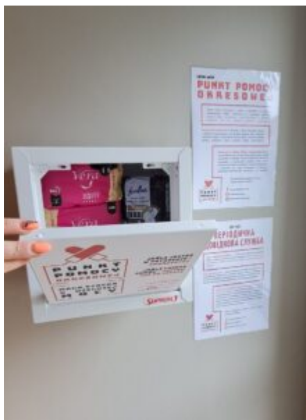
Punkt Pomocy Okresowej

Od teraz z takiej formy pomocy można korzystać również w Bibliotece Głównej przy ul. Jana Kilińskiego 16. Szafka ma swojego opiekuna, który raz w tygodniu w razie potrzeby uzupełnia brakujące środki. Każdy chętny może również we własnym zakresie uzupełnić Punkt artykułami higienicznymi.