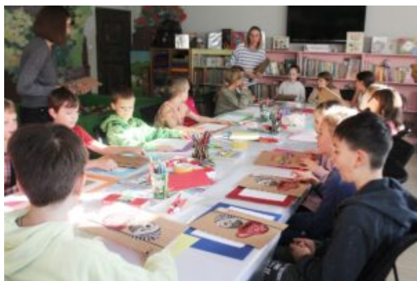
Rozgrywki z Funkiem

Wydarzenie zrealizowane w ramach projektu „Odżywić świat” dofinansowanego przez Fundację BGK w programie „Dzieci Kapitana Nemo-Edycja III”.