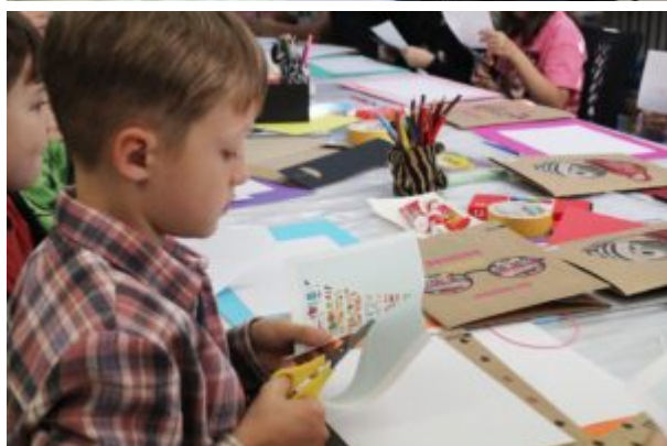
Rozgrywki z Funkiem