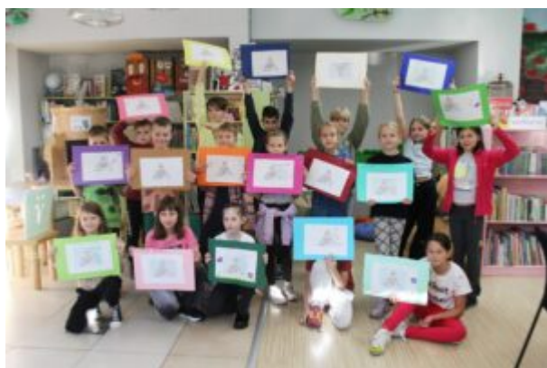
Rozgrywki z Funkiem