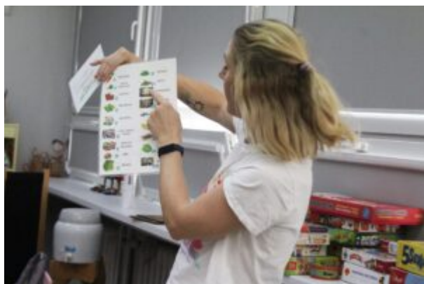
Rozgrywki z Funkiem