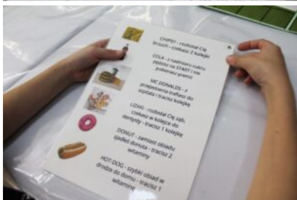
Rozgrywki z Funkiem