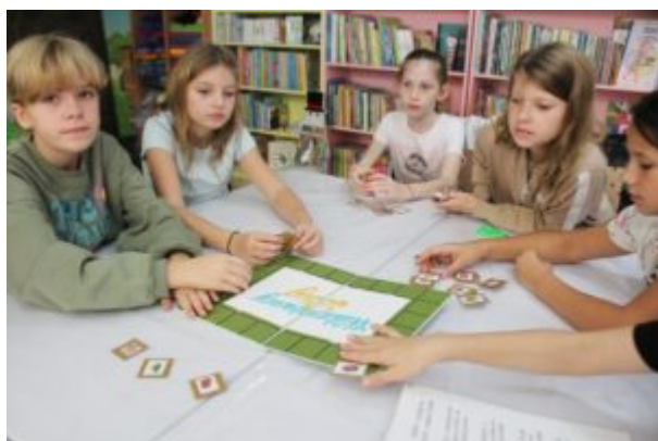
Rozgrywki z Funkiem