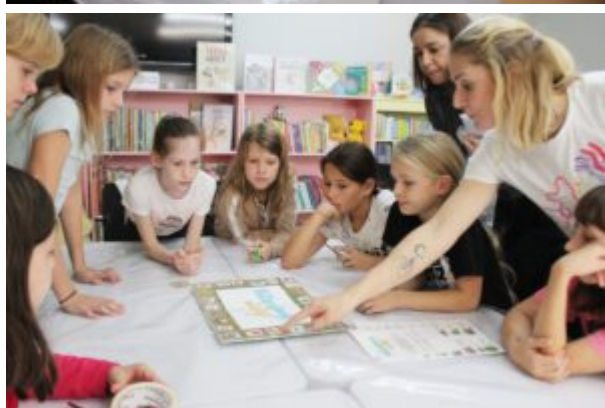
Rozgrywki z Funkiem