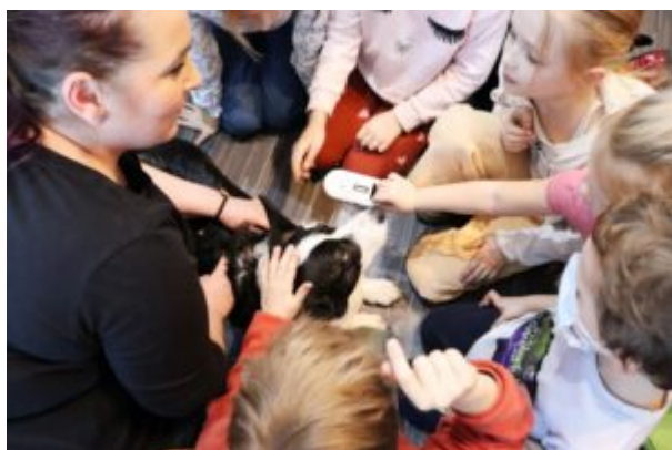
Spotkanie z TOZ