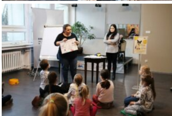
Spotkanie z TOZ