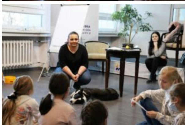
Spotkanie z TOZ