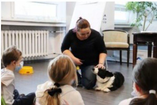
Spotkanie z TOZ

Dziękujemy za miłą i wartościową lekcję!