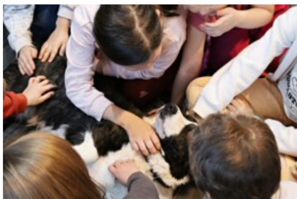
Spotkanie z TOZ