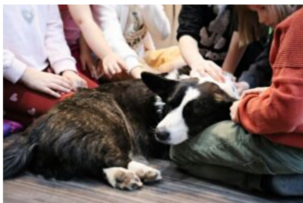
Spotkanie z TOZ