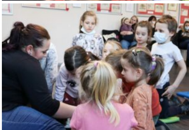
Spotkanie z TOZ