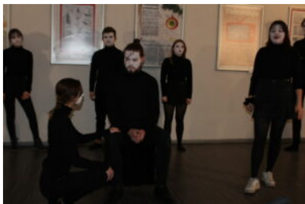
Wszystko jest poezja