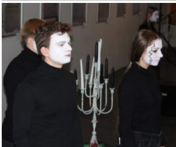
Wszystko jest poezja