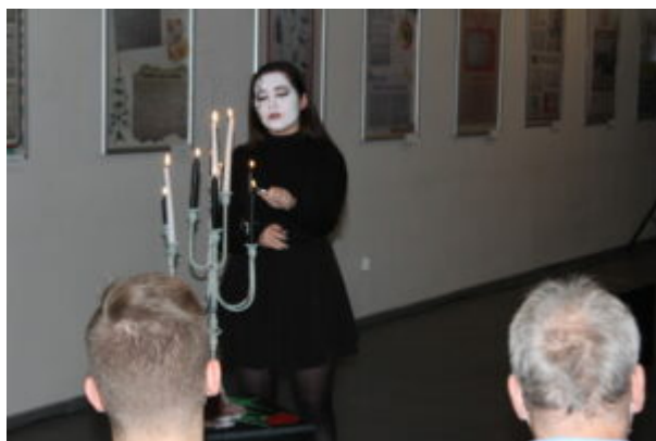
Wszystko jest poezja