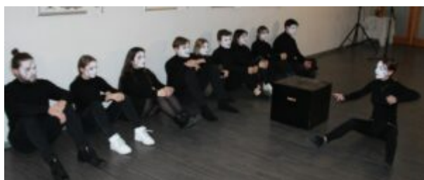
Wszystko jest poezja