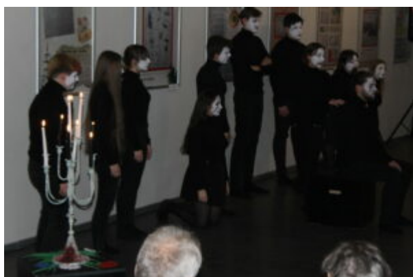
Wszystko jest poezja