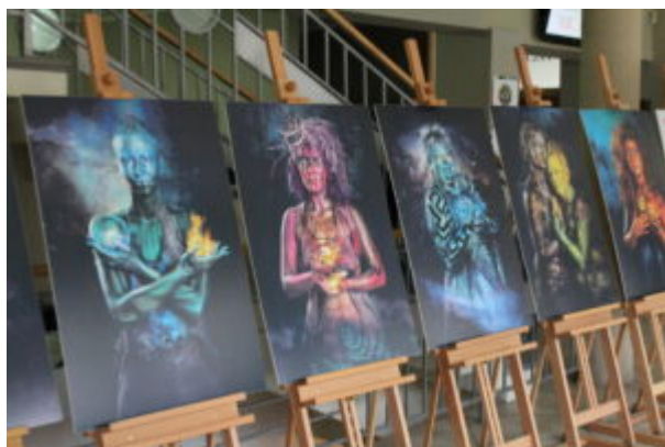
Wystawa Siła KobieTy