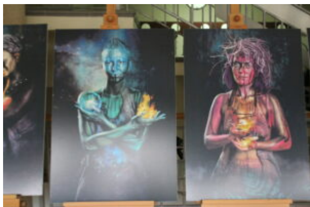
Wystawa Siła KobieTy

W holu Biblioteki Głównej od dzisiaj można podziwiać wystawę, która zwraca dużą uwagę na badania profilaktyczne kobiet. Siła KobieTy - bo tak nazywa się ekspozycja, to projekt artystyczno - społeczny, zwracający uwagę na profilaktykę nowotworów kobiecych. Prezentowane plansze przedstawiają siłę i solidarność 12 kobiet z województwa kujawsko-pomorskiego, które usłyszały diagnozę „nowotwór”. Autorami zdjęć są Madam Miko oraz Marcin Urzędowski, dla których inspiracją powstania takich zdjęć był film „Avatar”. Wystawa zwraca uwagę na to co najważniejsze czyli na zdrowie, a głównym przesłaniem jest hasło „BADANIA PROFILAKTYCZNE RATUJĄ ŻYCIE!” Ekspozycję można oglądać do 16 listopada w godzinach otwarcia Biblioteki.