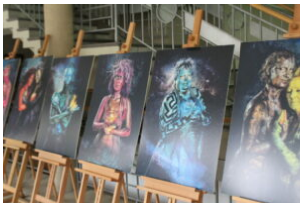
Wystawa Siła KobieTy

Siła KobieTy - twoje życie i zdrowie są ważne