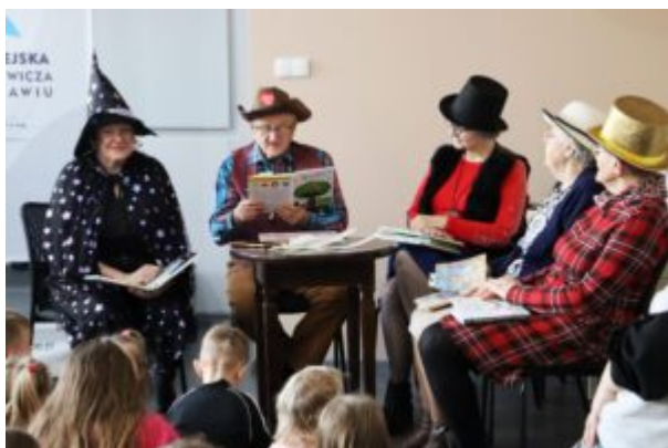
Filia nr 12

Zwieńczeniem obchodów było czwartkowe „Czytanie przez pokolenia” w Filii nr 12, gdzie seniorzy zaprzyjaźnieni z naszą Biblioteką prezentowali wiersze, bajki i czytanki edukacyjne polskich autorów. Dziadkowie czytają i opowiadają najpiękniej, o czym przekonali się uczestnicy spotkania, a wśród nich dzieci z Przedszkola Muzyczna Kraina i Zespołu Szkół im. Marka Kotańskiego oraz młodzież z Integracyjnego Centrum Aktywności Nadzieja Życia i Środowiskowego Domu Samopomocy w Inowrocławiu.