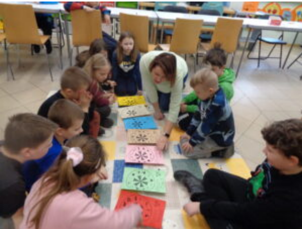
Filia nr 1