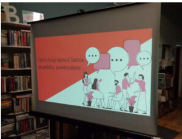
Filia nr 7