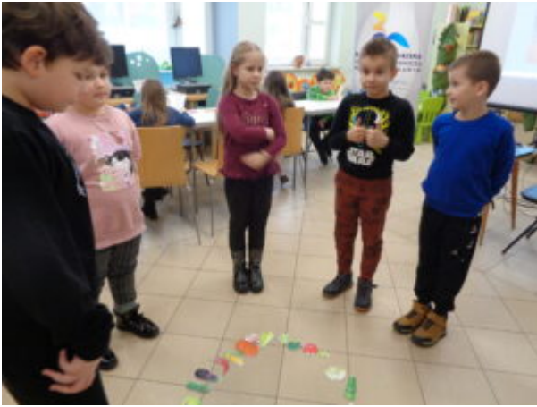
Filia nr 1