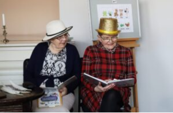
Filia nr 12