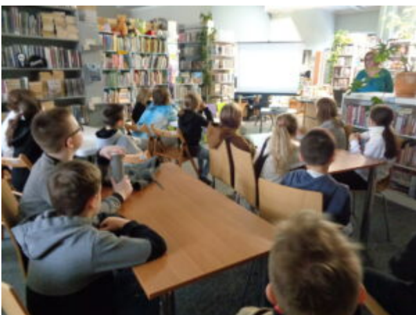
Filia nr 7