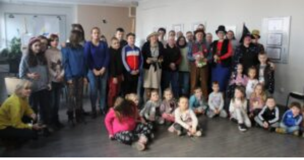
Filia nr 12