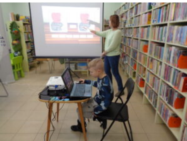
Filia nr 1