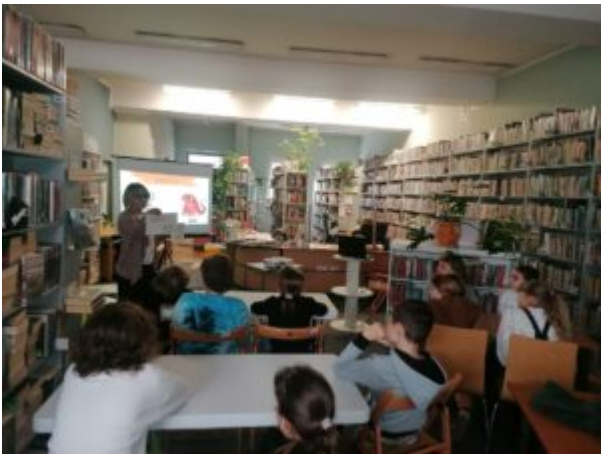
Filia nr 7