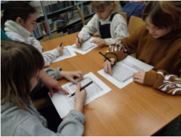
Filia nr 7