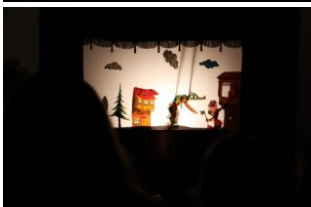
Teatr Cieni Ka