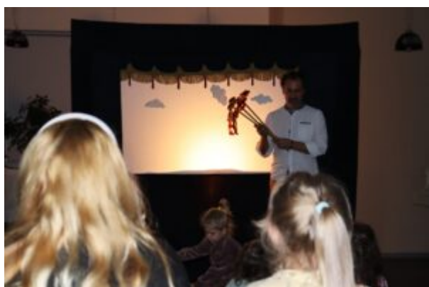
Teatr Cieni Ka