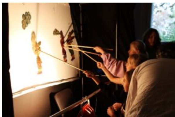
Teatr Cieni Ka