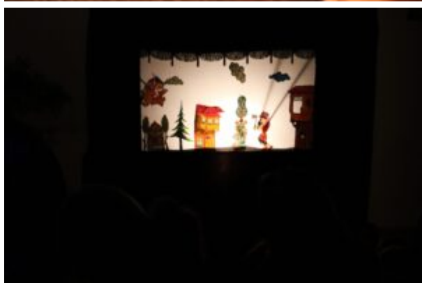
Teatr Cieni Ka