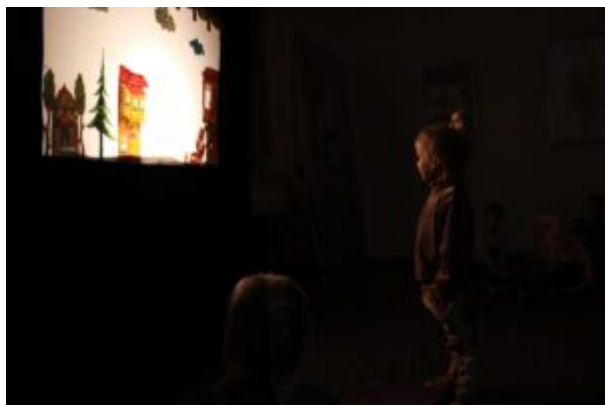
Teatr Cieni Ka