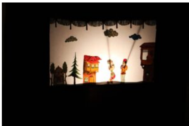
Teatr Cieni Ka

Wydarzenie zrealizowane w ramach projektu „Podróżowanie przez czytanie dofinansowanego ze środków Ministra Kultury i Dziedzictwa Narodowego.