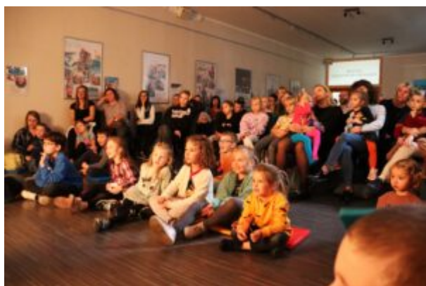
Teatr Cieni Ka