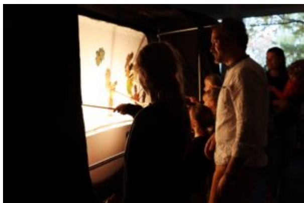
Teatr Cieni Ka