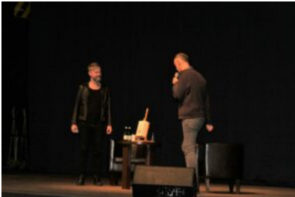
Spotkanie z Tomaszem Organkiem