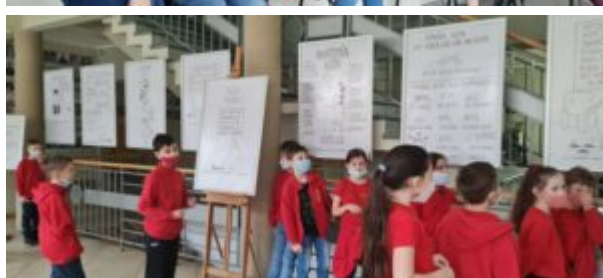
Dzień Języka Ojczystego