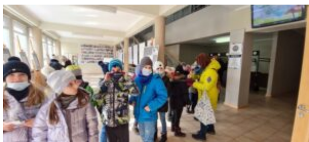
Dzień Języka Ojczystego

Dziś z okazji Dnia Języka Ojczystego księżnicę odwiedzili uczniowie III klasy Niepublicznej Szkoły Podstawowej „Jagiellonka”. Dzieciaki zwiedziły wystawę dotyczącą zapożyczeń językowych a także ekspozycję poświęconą kotom. Po tym przyszedł czas na zmagania z językiem polskim, w ramach przygotowanych przez Czytelnię Potyczek językowych . Podczas zajęć uczniowie poznawali znaczenie zapożyczonych słów i ćwiczyli łamańce językowe. Na zakończenie każdy otrzymał dyplom i biblioteczne gadżety.