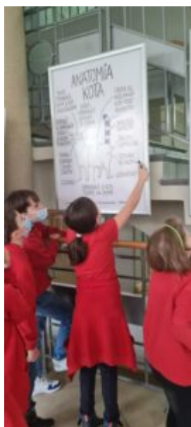
Dzień Języka Ojczystego