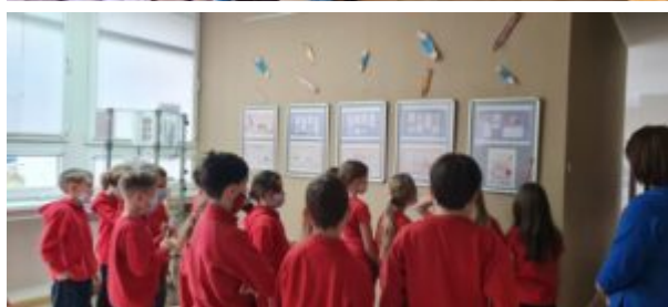
Dzień Języka Ojczystego