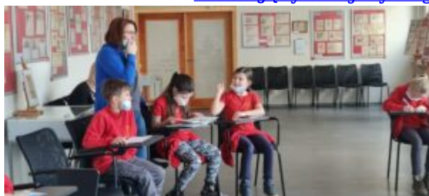
Dzień Języka Ojczystego