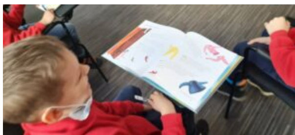
Dzień Języka Ojczystego