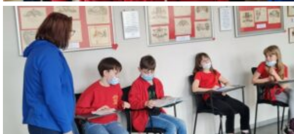
Dzień Języka Ojczystego