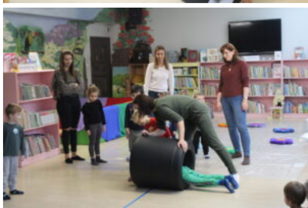
Warsztaty pełne wrażeń