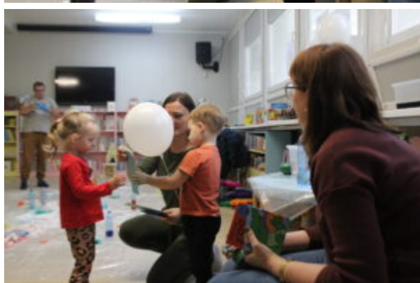
Warsztaty pełne wrażeń