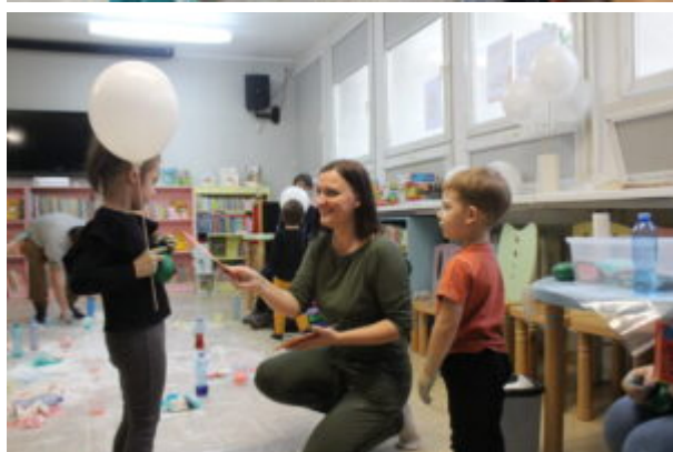
Warsztaty pełne wrażeń