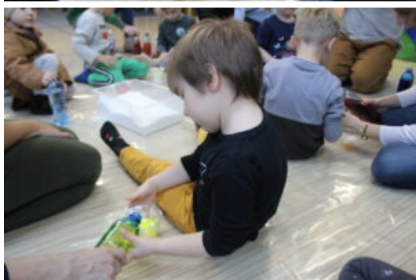
Warsztaty pełne wrażeń