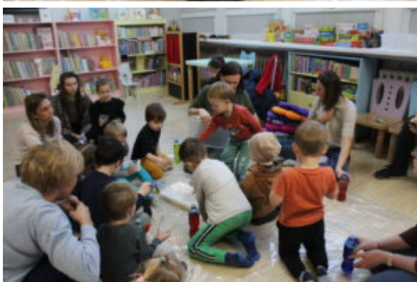
Warsztaty pełne wrażeń