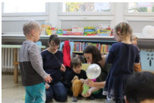
Warsztaty pełne wrażeń