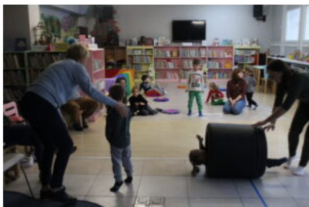
Warsztaty pełne wrażeń