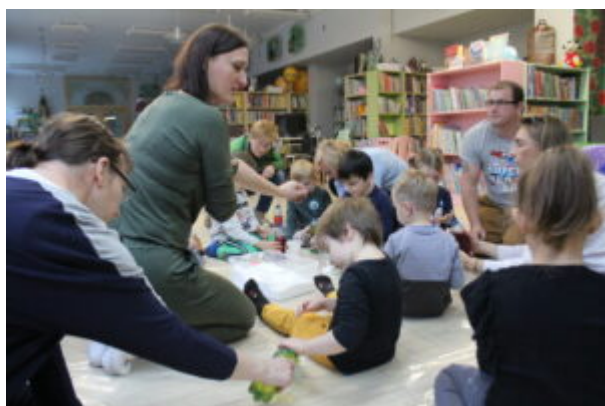
Warsztaty pełne wrażeń