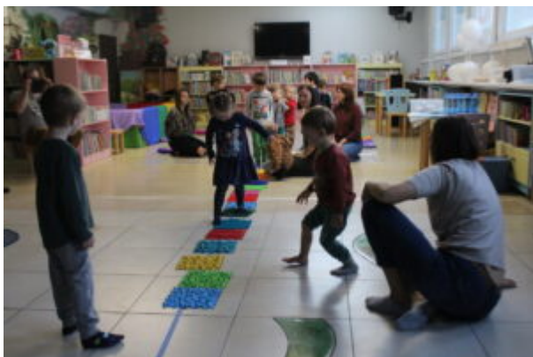
Warsztaty pełne wrażeń