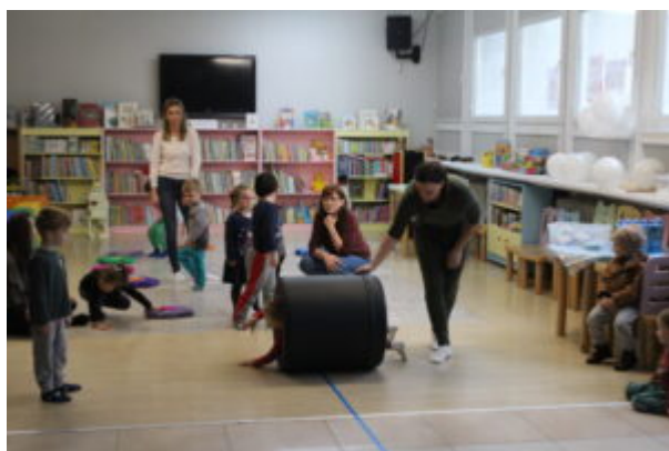
Warsztaty pełne wrażeń