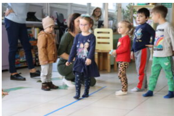
Warsztaty pełne wrażeń