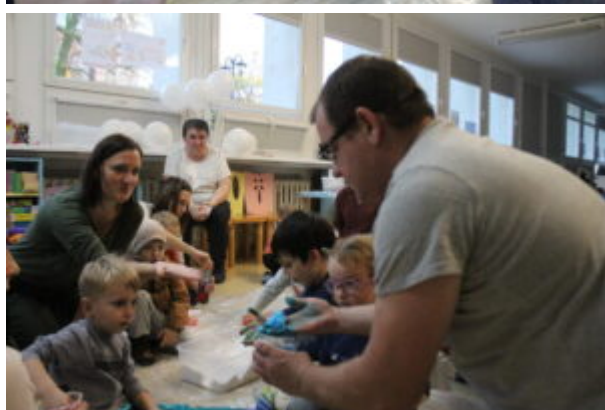
Warsztaty pełne wrażeń