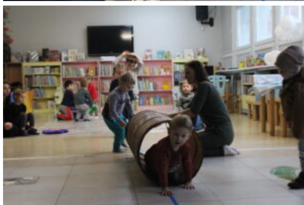
Warsztaty pełne wrażeń