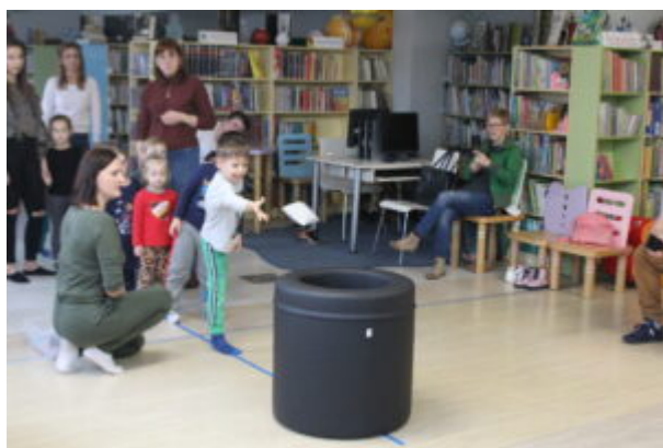
Warsztaty pełne wrażeń