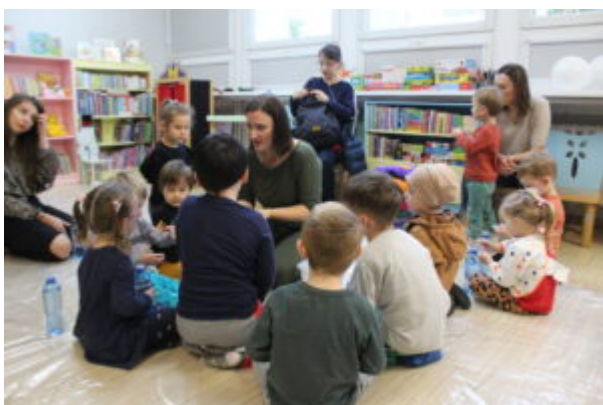
Warsztaty pełne wrażeń