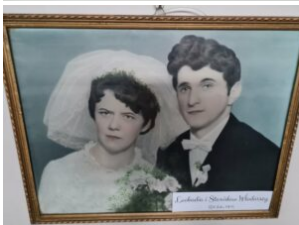
Wystawa "Monidła-zapomniane portrety"