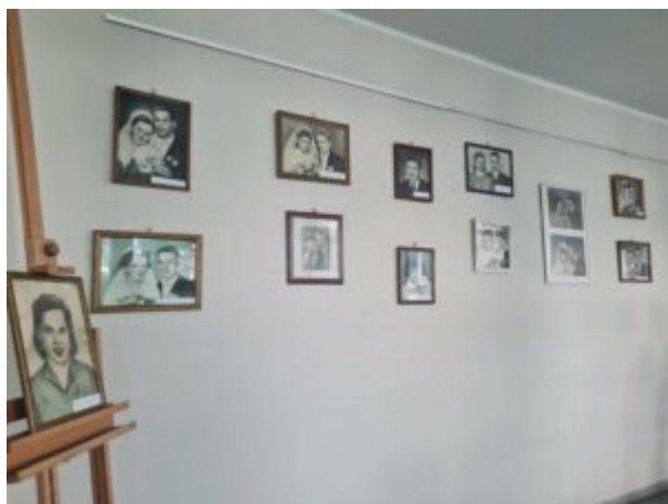
Wystawa "Monidła-zapomniane portrety"

Wystawę „Monidła-zapomniane portrety” można oglądać do 30 września. Wstęp wolny!