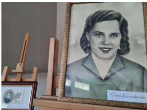
Wystawa "Monidła-zapomniane portrety"