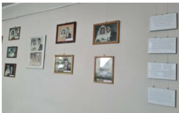
Wystawa "Monidła-zapomniane portrety"