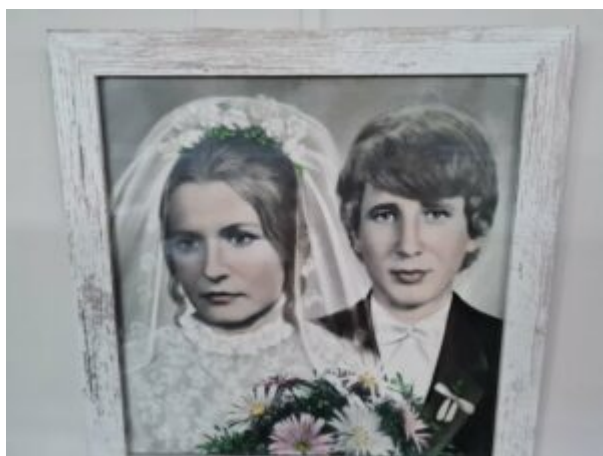
Wystawa "Monidła-zapomniane portrety"