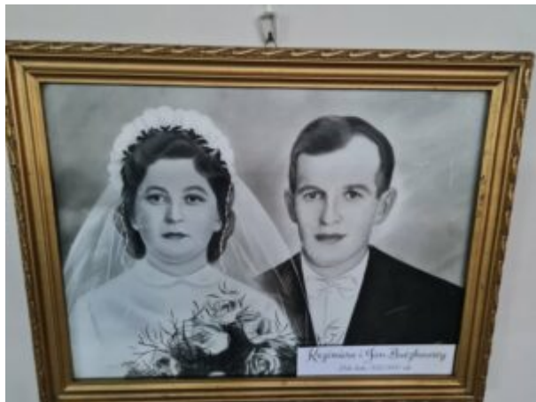
Wystawa "Monidła-zapomniane portrety"