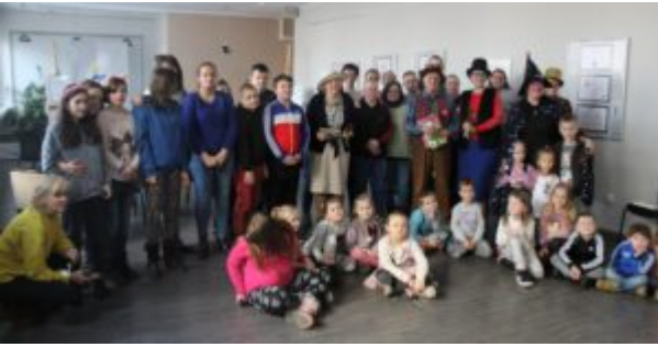
Filia nr 12